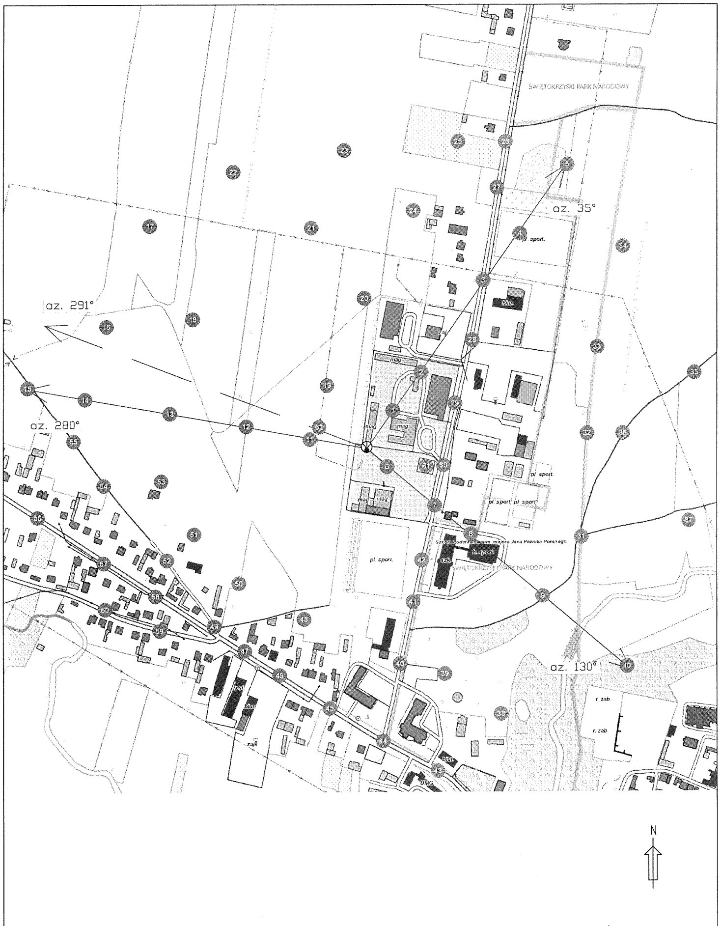
Rys.1 Lokalizacja pionów pomiarowych