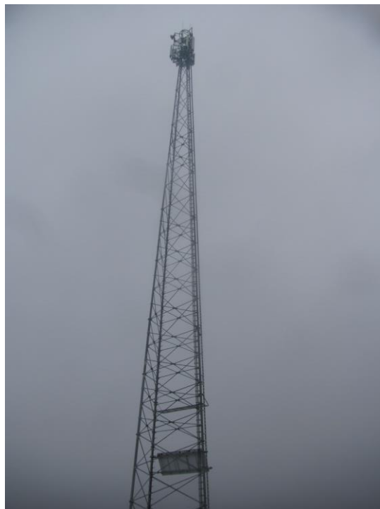
Zaf. nr 1: Widok ogólny instalacji radiokomunikacyjnej.