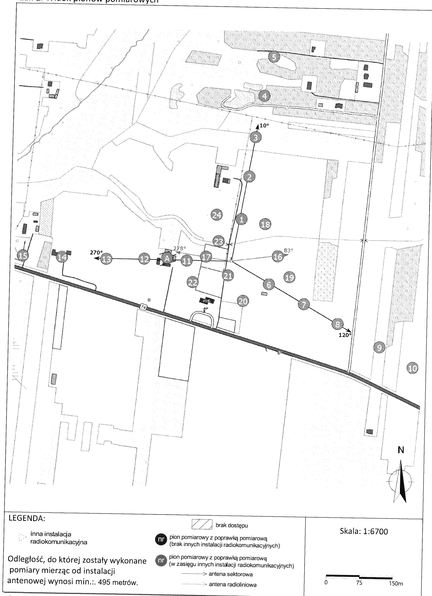
Zař. 2. Widok pionów pomiarowych