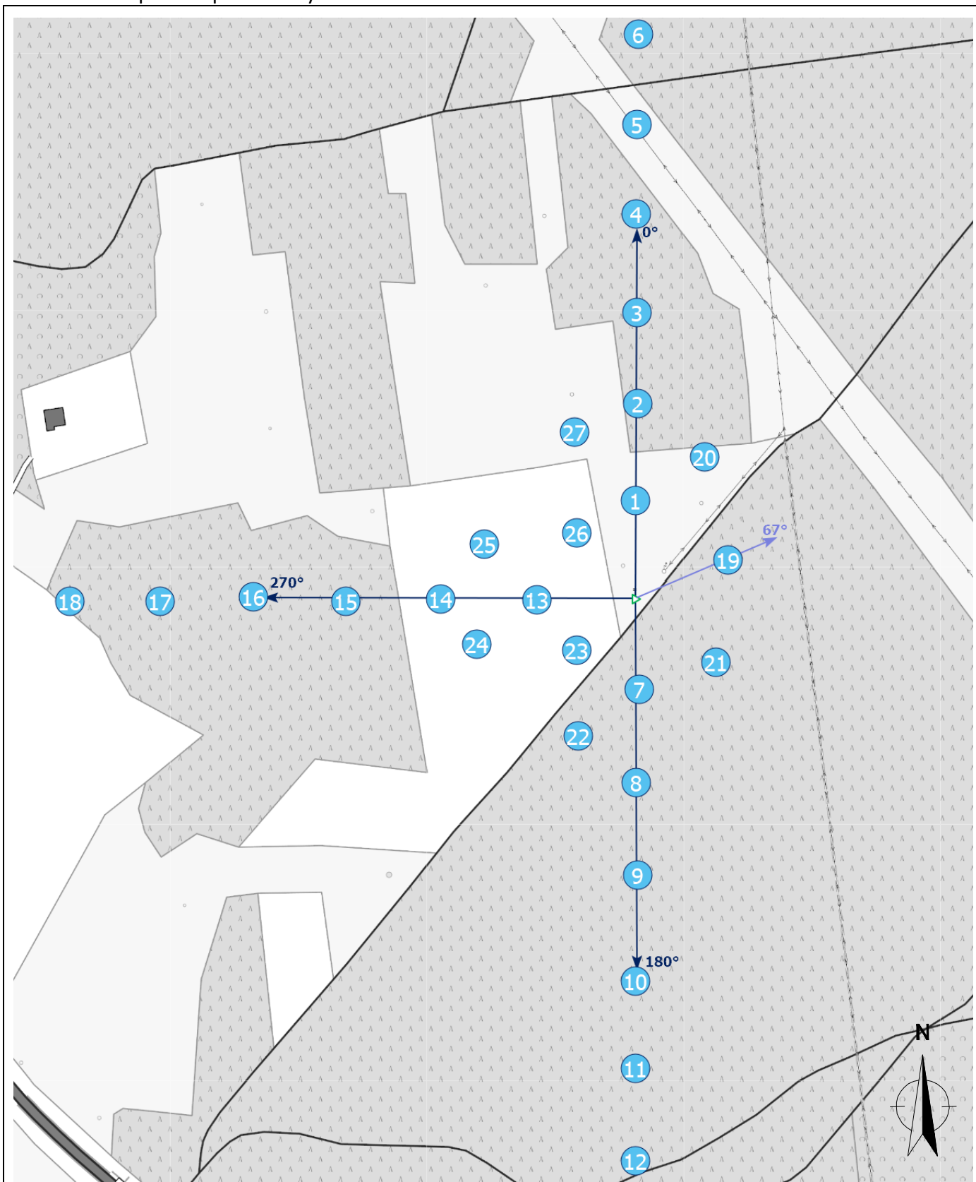
Załącznik 2. Widok pionów pomiarowych