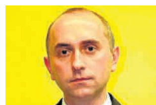
▶ 2. Rafał Kwiecień