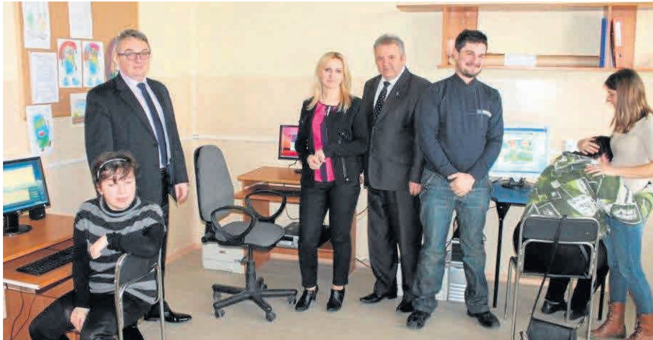
► Powiat kielecki i gmina Łągów przekazały pieniądze na wyposażenie i adaptację pomieszczeń w ośrodku w Sędku.

- Przekazaliśmy sześć zestawów komputerowych i drukarek, które posłużą do przeprowadzania zajęć informatycznych oraz nauki obsługi komputera dla niepełnosprawnych uczestników warsztatów. Cieszę się, że udało nam się w taki sposób doposażyć warsztaty, ponieważ zajęcia tutaj służą rehabilitacji zawodowej i społecznej osób niepełnosprawnych. Jak wiemy, obsługa komputera czy znajomość środowiska internetu oraz bie-