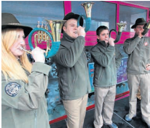
► Zespół Sygnalistów Myśliwskich z Zagnańska.

● Przypomnijmy, co działo się w Kielcach na scenie Starostwa Powiatowego. Spisał się też Piekoszów