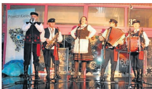
► Zagrała też Kapela Bielińska.