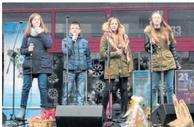
► Zespół Wiktoria z Gimnazjum w Wolicy.