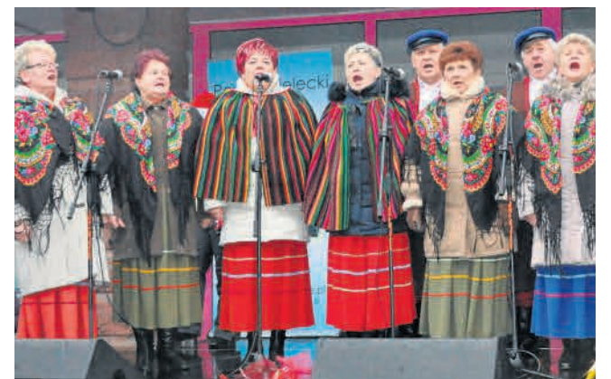
► Zespół Śpiewaczy Bolechowiczanie zagrał z przytupem.