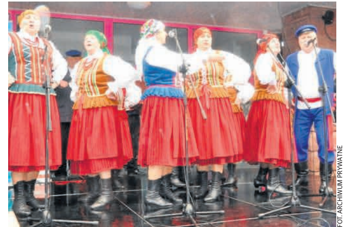
► Świętą rozgrzewkę zapewnili Leśnianie z gminy Bodzentyn.