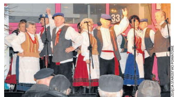
► Publiczność porwał do zabawy Zespół Pieśni i Tańca Wincetowianie.