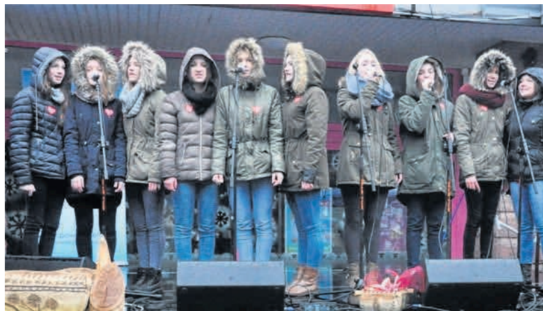
► Młodzieżowy akcent w wykonaniu zespołu Tu i Teraz z Nowin.