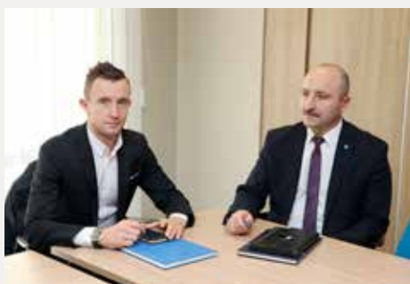
Obradowali radni z Komisji Rolnictwa, Leśnictwa, Gospodarki Gruntami i Ochrony Środowiska.