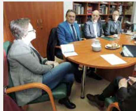
Spotkanie w sprawie 80. rocznicy pacyfikacji Szalas.