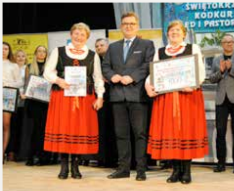
27. Finał Świętokrzyskiego Konkursu Kolęd i Pastorałek we Włoszczowie.