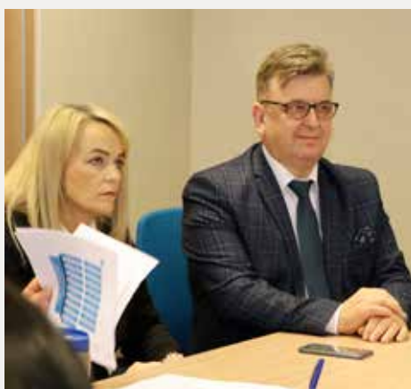
„Akademia specjalnych potrzeb edukacyjnych” – posiedzenie robocze partnerów projektu.