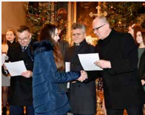
Wieczór Kolęd w Bielinach.