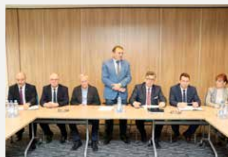
Sprzeciw powiatu wobec podwyżek opłat za wywóz śmieci.