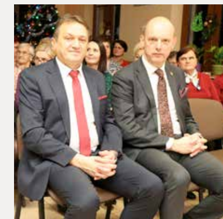
Noworoczny koncert kolęd w Jaworzu.