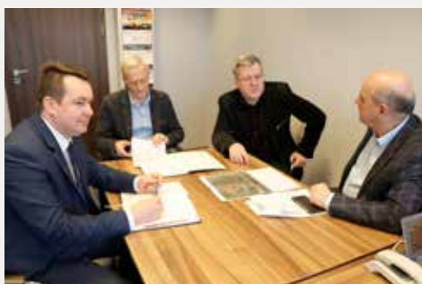
Trwają rozmowy w sprawie drogi powiatowej w Łopusznie.