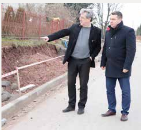
Postęp prac na powiatowych drogach w Gminie Zagnańsk.