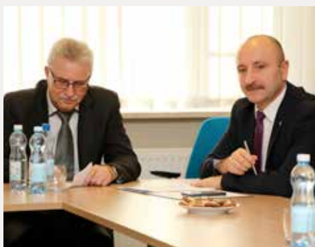
Spotkanie z władzami gmin z powiatu kieleckiego.