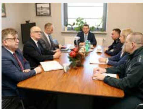
Współpraca służb w celu zapewnienia bezpieczeństwa uczestnikom wyjazdów na ferie zimowe.