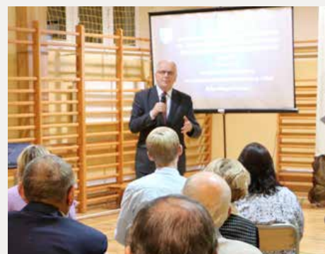
Powiatowa Rada Działalności Pożytku Publicznego w Kielcach o wsparciu finansowym organizacji pozarządowych