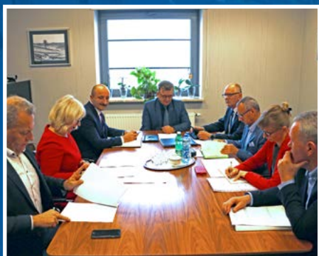
O przyszłości szpitali z dyrektorami jednostek.