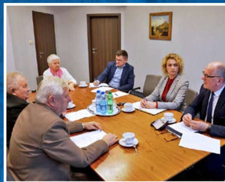
Posiedzenie Powiatowej Rady Kombatantów i Osób Represjonowanych.