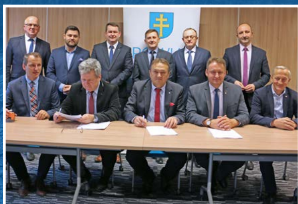
Podpisanie umów na kolejne drogi w ramach Funduszu Dróg Samorządowych.