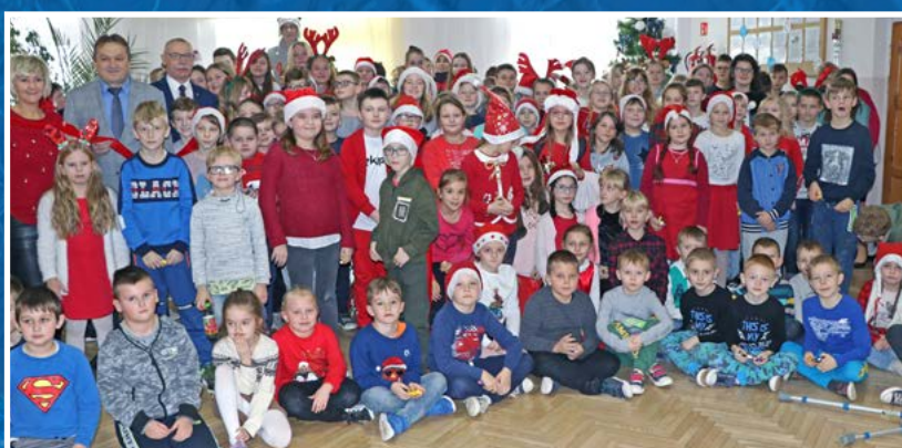
Starosta z mikołajkową wizytą w szkole w Mąchocicach-Scholasterii.