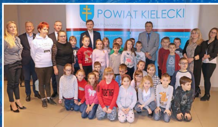
V edycja Konkursu „Junior + Przedsiębiorczość = Sukces”