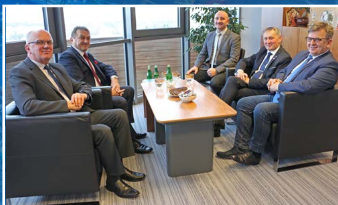
Wojewoda świętokrzyski Zbigniew Koniusz odwiedził Zarząd Powiatu w Kielcach.