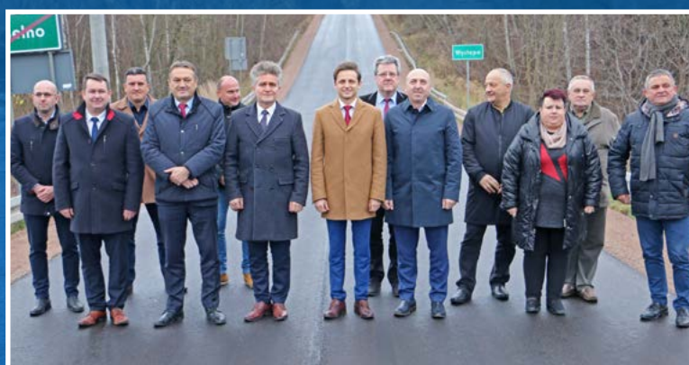
Otwarcie drogi Belno – Występa na styku dwóch powiatów.