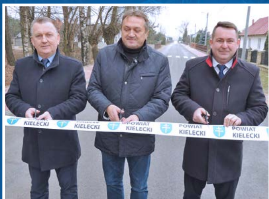
Nowe chodniki oddane do użytku w Gminie i Mieście Chęciny.