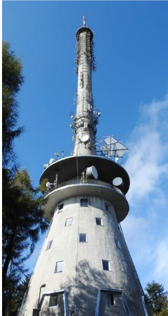
Fot. 1. RTCN Kielce / Święty Krzyż – widok obiektu