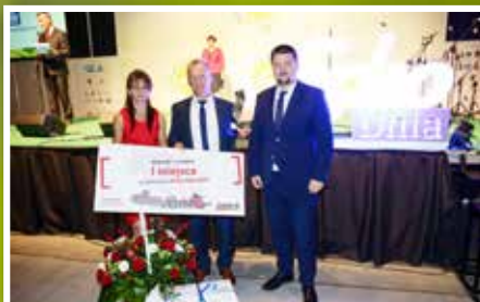
Gała plebiscytu Rolnik Roku 2018