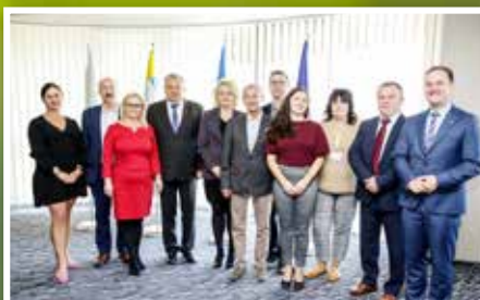
Podsumowanie działalności Powiatowej Rady Działalności Pożytku Publicznego w Kielcach III kadencji