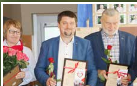
Uroczyste oddanie do użytku windy w WZT w Bielnie