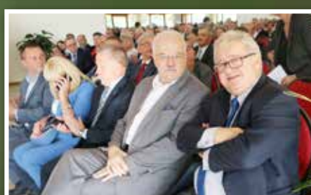
Zjazd Sołtysów Powiatu Kieleckiego