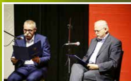
Narodowe Czytanie Przedwiośnia w Ciekotach