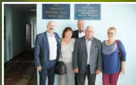
Wizyta w partnerskim dla powiatu kieleckiego mieście Tulczyn na Ukrainie