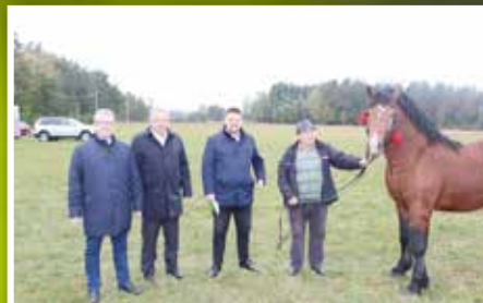
IV Wystawa - Kwalifikacja Ogierów Rasy Zimnokrwistej w Woli Łagowskiej