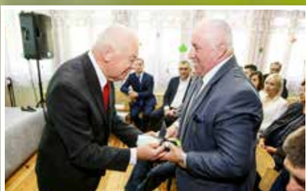
Jubileusz 80-lecia Powiatowego Szkolnego Schroniska w Nowej Słupi