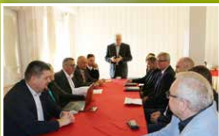
Obrady XLIV Konwentu Dyrektorów Zarządów Dróg Powiatowych Województwa Świętokrzyskiego