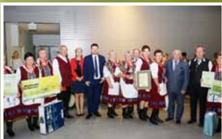
Gała konkursów Rolnik Roku 2018 i Gospodynie i Gospodarze Wiejscy 2018