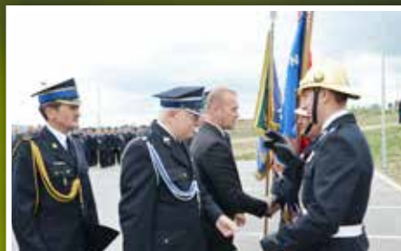
95-lecie Ochotniczej Straży Pożarnej w Górnicy