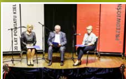
Narodowe Czytanie Przedwiośnia w Ciekotach