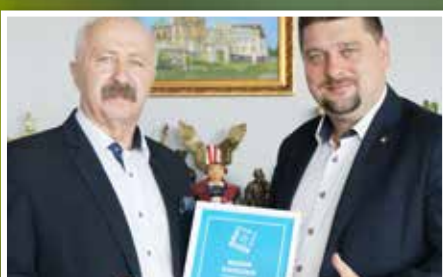
Wyróżnienie w Konkursie Mała Ojczyzna Wielka Sprawa