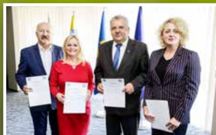
Podsumowanie działalności Powiatowej Rady Działalności Pożytku Publicznego w Kielcach