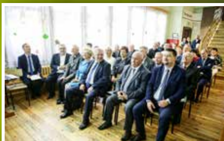
80-lecie Powiatowego Szkolnego Schroniska w Nowej Słupi