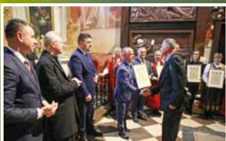
XIII Powiatowy Przegląd Zespołów Chóralnych na Św. Krzyżu