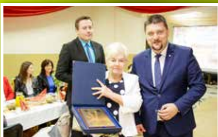
10-lecie Towarzystwa Przyjaciół Brzezin i Podwala