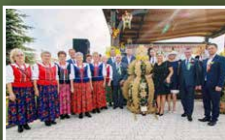
Dożynki Gminy Sitkówka-Nowiny