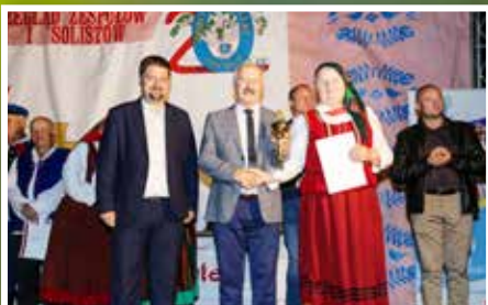
Przegląd Zespołów Folklorystycznych i Solistów w Chmielniku