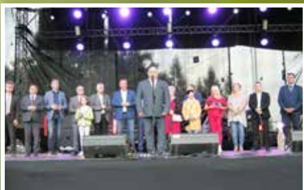
Dymarki Świętokrzyskie w Nowej Słupi