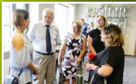
Przekazanie dofinansowań w konkursie „Program dla sołectw”