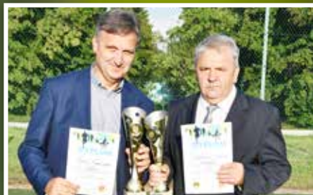
XII Święto Sportu w Lechowie