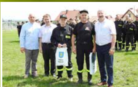
Gminne Zawody Sportowo-Pożarnicze Ochotniczych Straży Pożarnych w Pierzchnicy