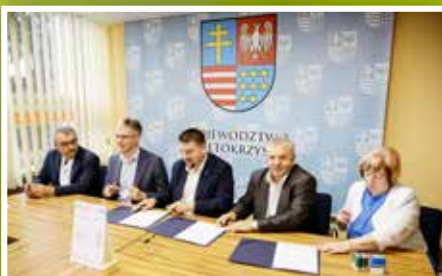
Podpisanie umów w ramach projektu „Liderzy kooperacji”