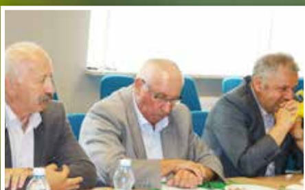
Konferencja prasowa w sprawie Dożynek Powiatu Kieleckiego i Gminy Pierzchnica