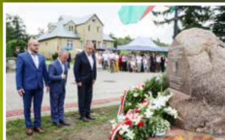
Obchody Święta Czynu Chłopskiego w Wiernej Rzece