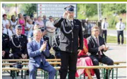
100-lecie OSP w Sukowie