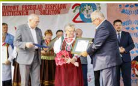
Przegląd Zespołów Folklorystycznych i Solistów w Chmielniku