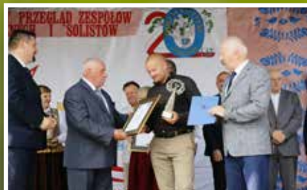
Przegląd Zespołów Folklorystycznych i Solistów w Chmielniku