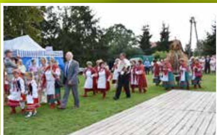
Dożynki Gminy Chmielnik w Piotrkowicach