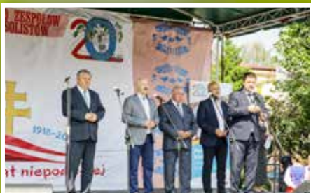
Przegląd Zespołów Folklorystycznych i Solistów w Chmielniku