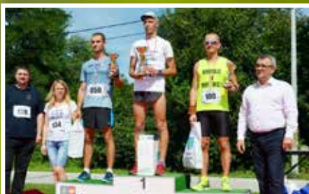
II Bieg Charytatywny w Morawicy