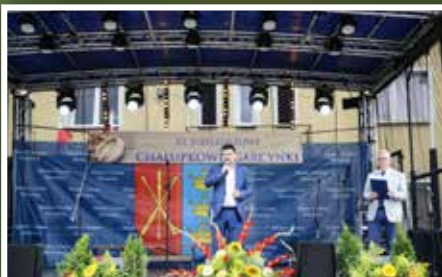
Festyn „Chałupcowe Garcynki” w Chałupkach