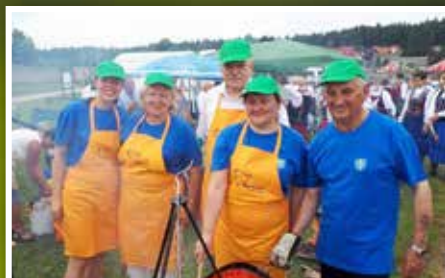
VI Festiwal Zupy Rybnej „Złota Rybka” w Wilkowie