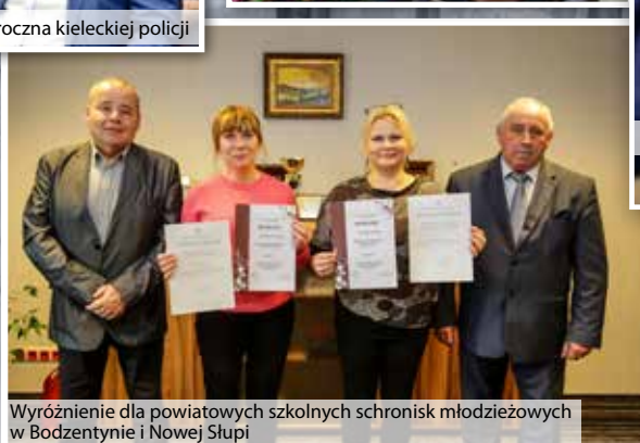
Wyróżnienie dla powiatowych szkolnych schronisk młodzieżowych w Bodzentynie i Nowej Słupi