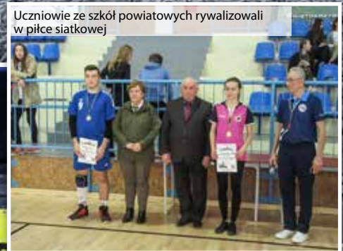
Uczniowie ze szkół powiatowych rywalizowali w piłce siatkowej