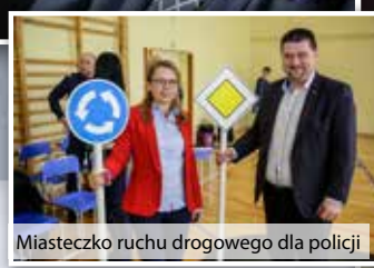
Miasteczko ruchu drogowego dla policji