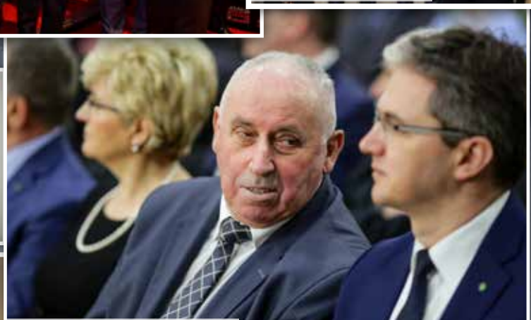
Łągów odzyskał prawa miejskie