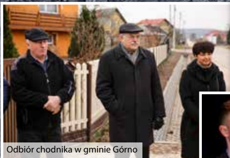
Odbiór chodnika w gminie Górno