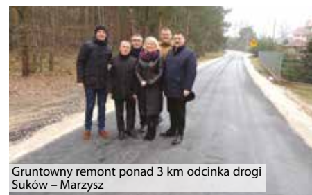
Gruntowny remont ponad 3 km odcinka drogi Suków – Marzysz

Część druga zadania obejmowała przebudowę drogi na odcinku 1766 m. W ramach inwestycji poszerzono jezdnię, położono nową nawierzchnię na odcinku od szkoły do granic Porzeczca z Bobrzą, ułożono bezpieczny chodnik, wyregulowano spływ