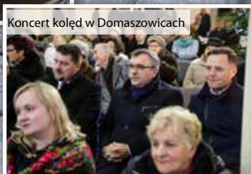
Koncert kołęd w Domaszowicach