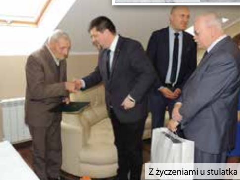
Z życzeniami u stulatka