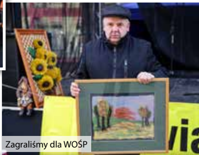
Zagraliśmy dla WOŚP