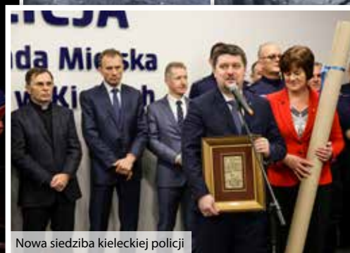
Nowa siedziba kieleckiej policji