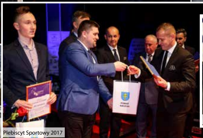
Plebiscyt Sportowy 2017