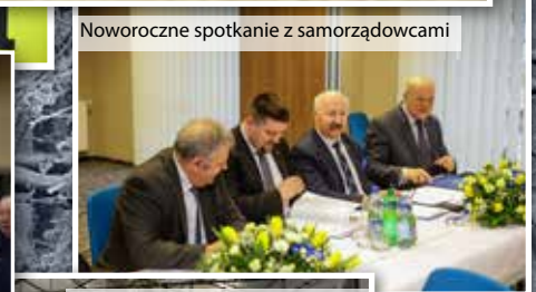
Noworoczne spotkanie z samorządowcami