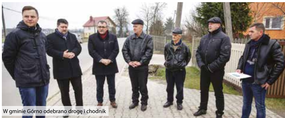
W gminie Górno odebrano drogę i chodnik

W trakcie odbioru starosta kielecki podkreślił, że dzięki dobrej współpracy samorządów udaje się zrealizować wiele ważnych dla regionu inwestycji drogowych: – Taka kreatywna i dobra współpraca przynosi same korzyści, szczególnie dla mieszkańców, którzy mogą korzystać z odnowionej drogi i chodnika.