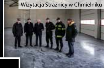
Wizytacja Strażnicy w Chmielniku