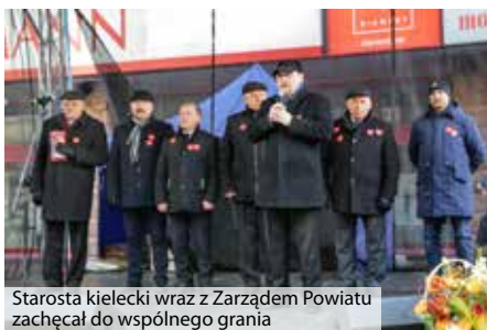
Starosta kielecki wraz z Zarządem Powiatu zachęcał do wspólnego grania

Kiedy zamilkła muzyka, zaczęły się licytacje często cennych przedmiotów. Chętnych nie brakowało. Pod naszą sceną ustawiali się także stali bywalcy powiatowego grania. Pokazaliśmy, że mamy wielkie serca. Nasza publiczność chętnie wrzucała