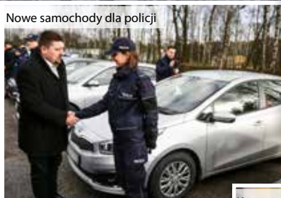
Nowe samochody dla policji