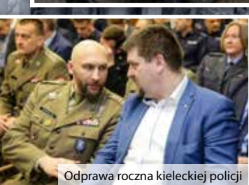
Odprawa roczna kieleckiej policji