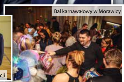
Bał karnawałowy w Morawicy