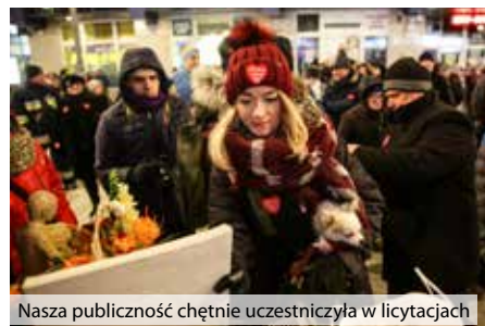
Nasza publiczność chętnie uczestniczyła w licytacjach