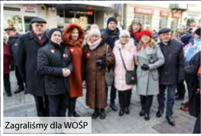
Zagraliśmy dla WOŚP