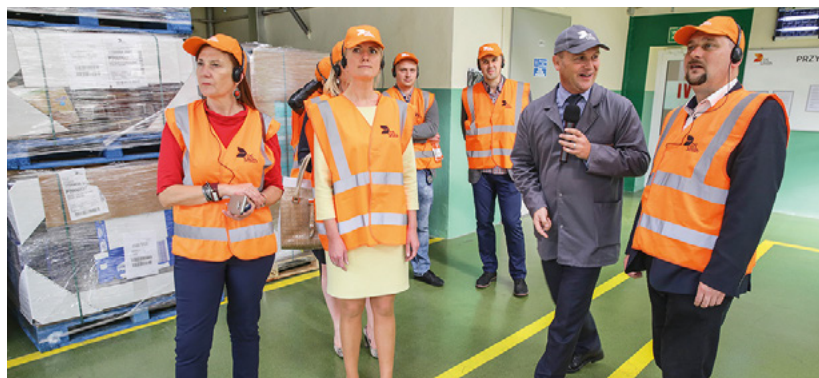
Otwarcie nowej fabryki DS Smith Polska.