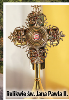
Relikwie św. Jana Pawła II.