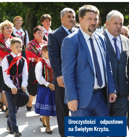
Uroczystości odpustowe na Świętym Krzyżu.