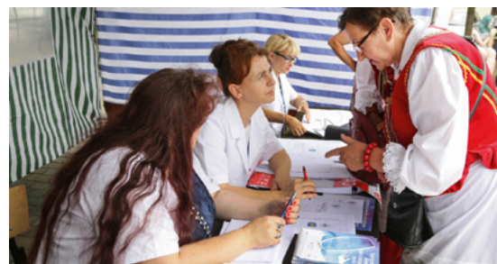
Punkt informacji medycznej powiatu kieleckiego.