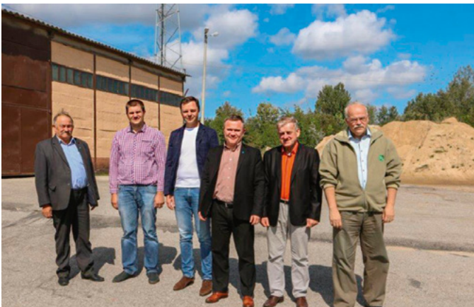
Komisja drogowa z wizytą w Łagowie.