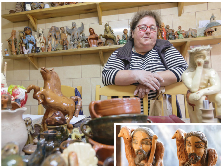
Artystka ze swoimi pracami w domu. Wśród jej figurerek można dostrzec anioła, ale także czarownicę.

Wierna jest temu, co robi. – Czasami przechodzą do mnie i zamawiają coś, jakieś prezenty. Dzbanuszki na wesele, prezenty dla młodej pary,