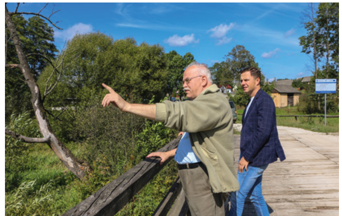
Drewniany most w Smykowie.