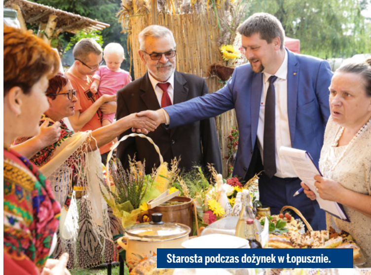
Starosta podczas dożynek w Łopusznie.