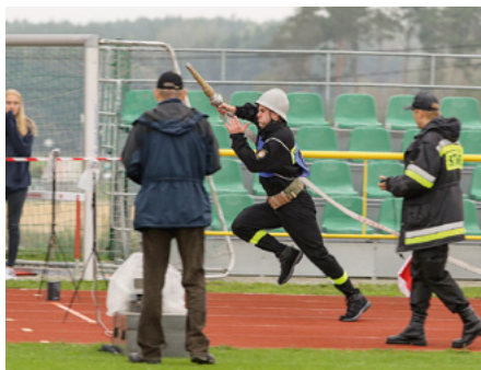
Poziom rywalizacji podczas zawodów był bardzo wysoki.

W zawodach wystartowało 41 drużyn pożarniczych. Rywalizacja toczyła się w czterech