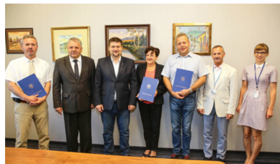
Podpisanie umów w Starostwie Powiatowym w Kielcach.