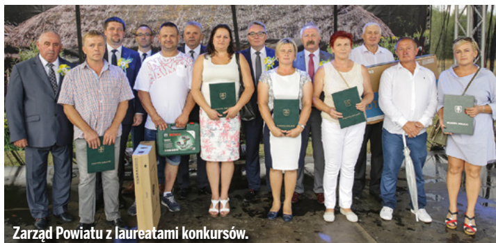
Zarząd Powiatu z laureatami konkursów.