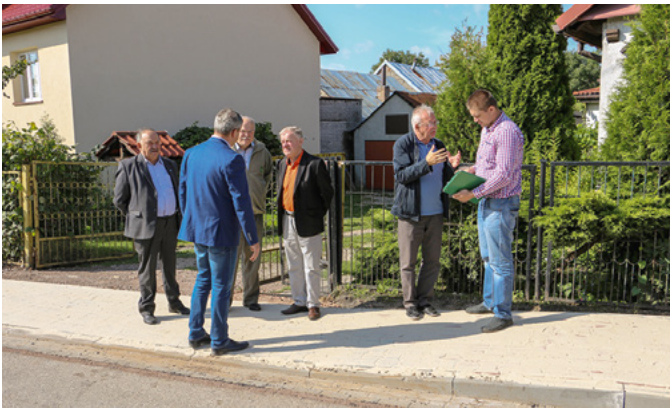
Chodnik w Mójczy.