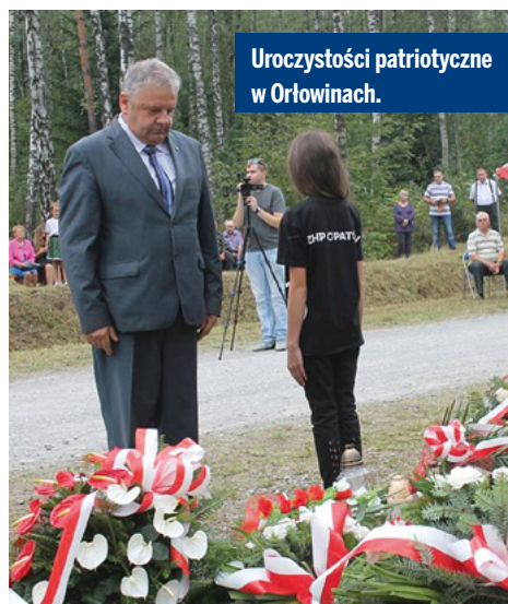
Uroczystości patriotyczne w Orłowinach.