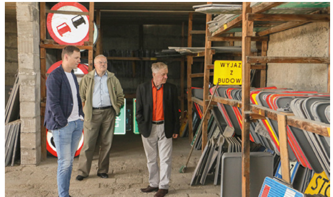
Baza obwodu drogowego w Łagowie.