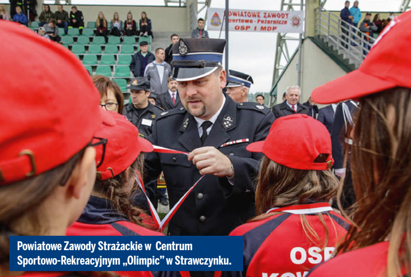
Powiatowe Zawody Strażackie w Centrum Sportowo-Rekreacyjnym „Olimpic” w Strawczynku.