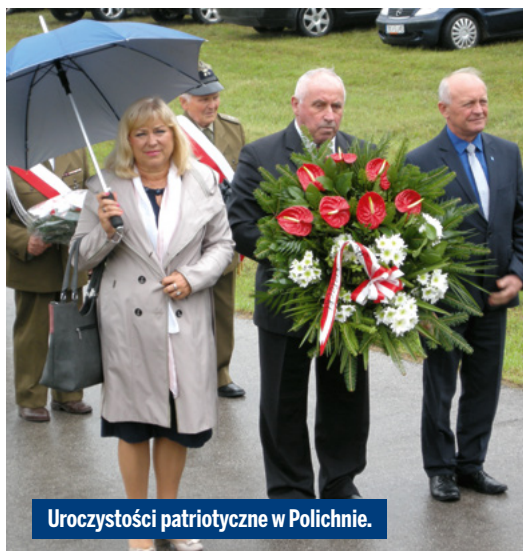
Uroczystości patriotyczne w Polichnie.