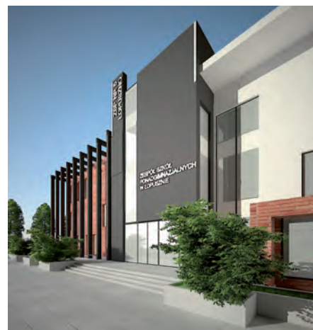
Wizualizacja nowego budynku szkoły w Łopusznie.

Natomiast dziewczyny z drugiej klasy liceum twierdzą, że one zawsze będą uczen-