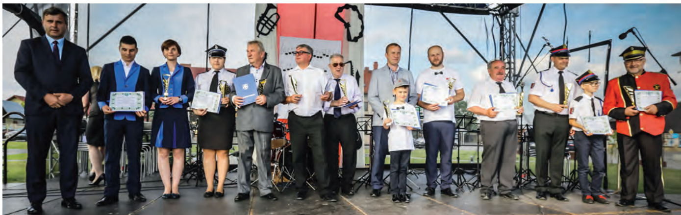
Laureaci Powiatowego Przeglądu Orkiestr Dętych w Daleszycach.