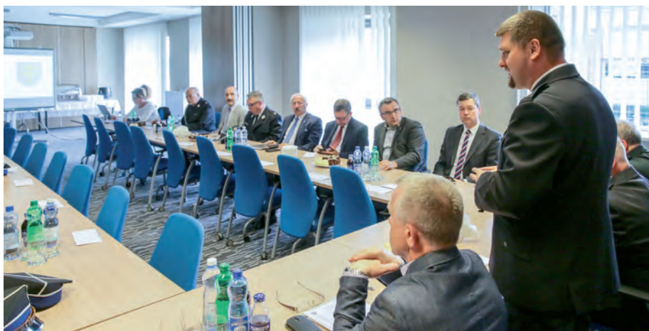
Spotkanie z prezesami i komendantami zarządów gminnych OSP z powiatu kieleckiego.