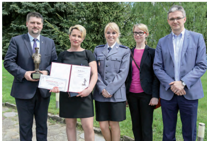
Ważny dzień dla Powiatu Kieleckiego. Otrzymaliśmy statuetkę „Koziołek”.