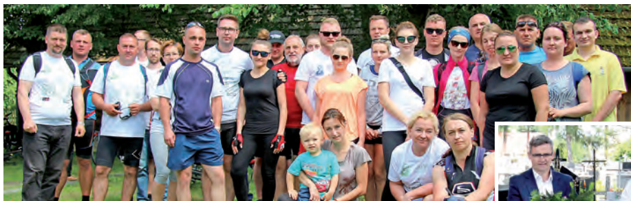
Celem rajdu były popularyzacja postaci Wincentego Witosza oraz integracja uczestników rajdu. Na zdjęciu z prawej: złożenie kwiatów na grobie Witosza w Wierchosławicach.

Ważna jest także kwestia integracji osób biorących udział w rajdzie, towarzysząca temu dobra zabawa oraz sprawdzenie swoich fizycznych i sportowych umiejętności. Dla wielu