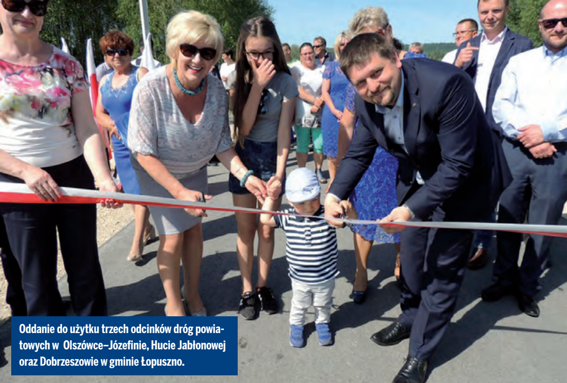
Oddanie do użytku trzech odcinków dróg powiatowych w Olszówce-Józefinie, Hucie Jabłonowej oraz Dobrzeszowie w gminie Łopuszno.