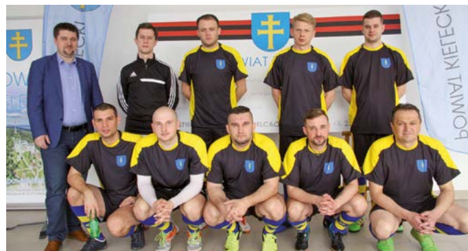
Drużyna kieleckiego Starostwa.