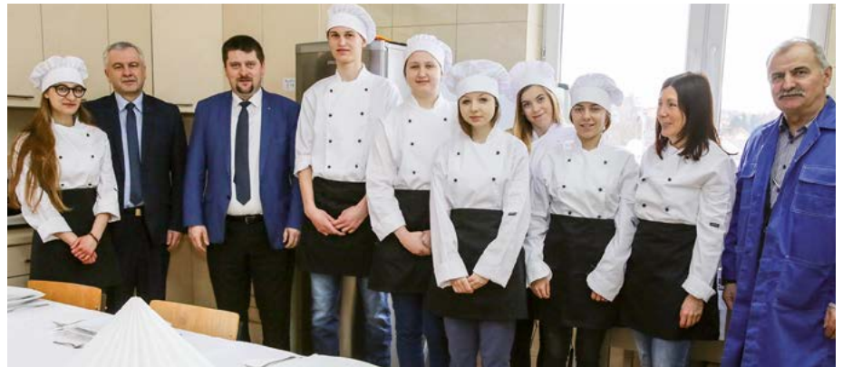
Uczniowie z technikum żywienia podczas praktyki zawodowej.