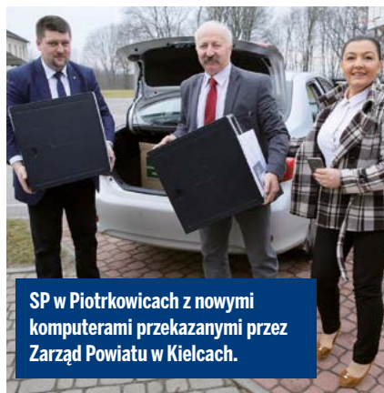
SP w Piotrkowicach z nowymi komputerami przekazanymi przez Zarząd Powiatu w Kielcach.