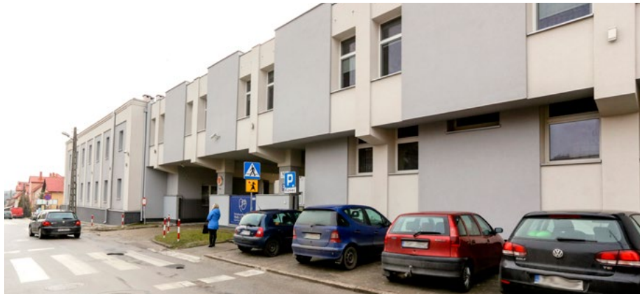
Szpital przy ul. Prostej – najlepszy w regionie.

w naszym szpitalu mogą nie tylko liczyć na profesjonalną opiekę, ale też korzystać podczas porodu z wielu form łagodzenia bólu.