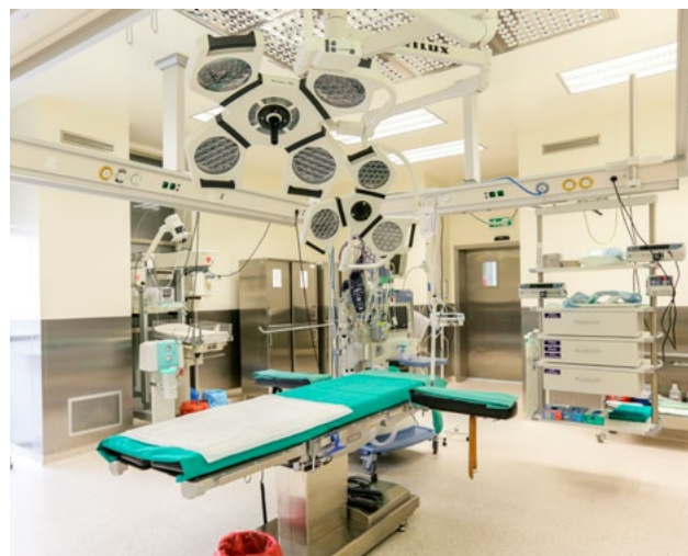
Nowoczesny sprzęt w sali operacyjnej.