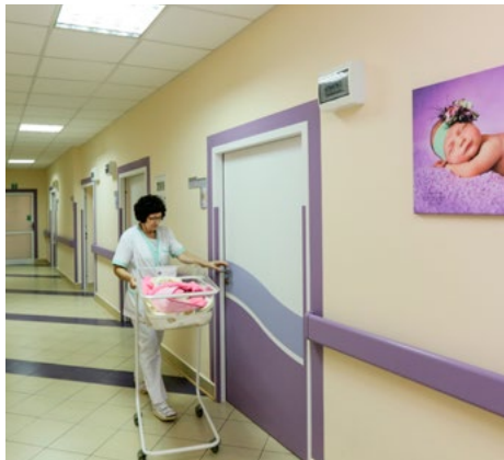
W szpitalu zakończono prace remontowe.