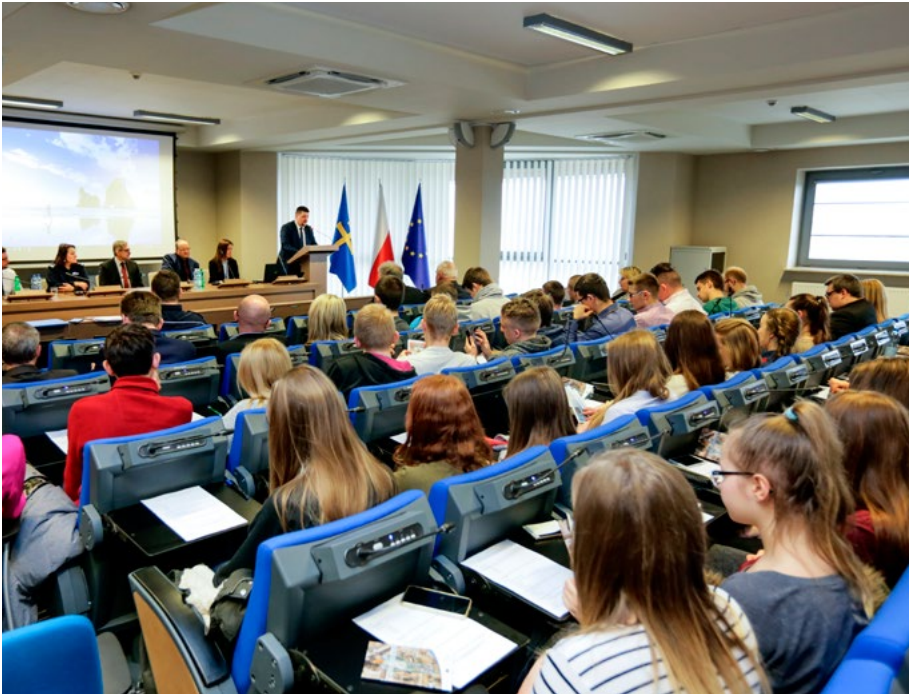
Temat handlu ludźmi zainteresował młodzież ze szkół powiatu kieleckiego.