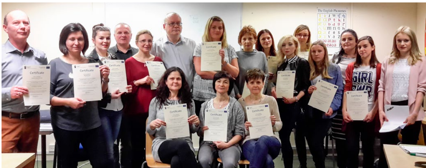
Na potwierdzenie odbytego szkolenia nauczyciele otrzymali certyfikaty.