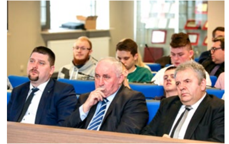
W konferencji wzięli udział starosta oraz członkowie Zarządu Powiatu.