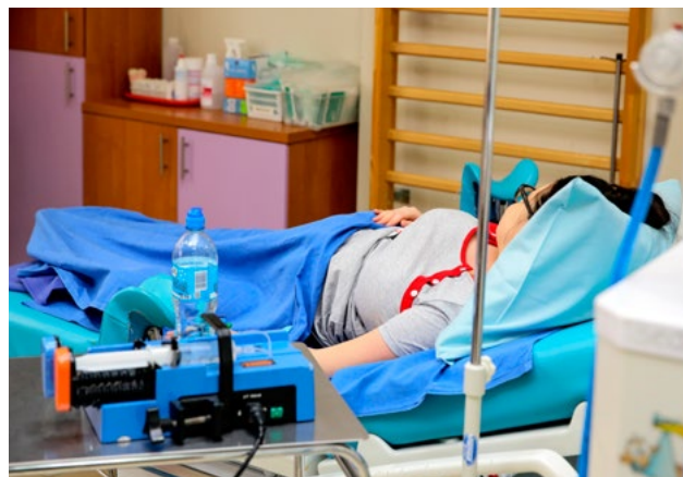
Sala do porodów rodzinnych.