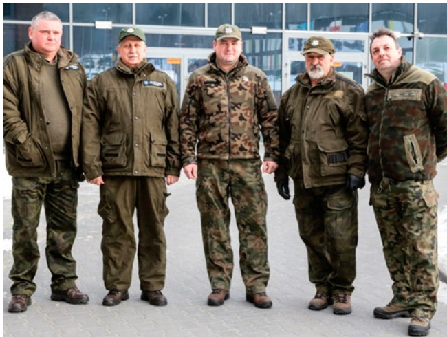
Inspektorzy ds. leśnictwa kieleckiego Starostwa.