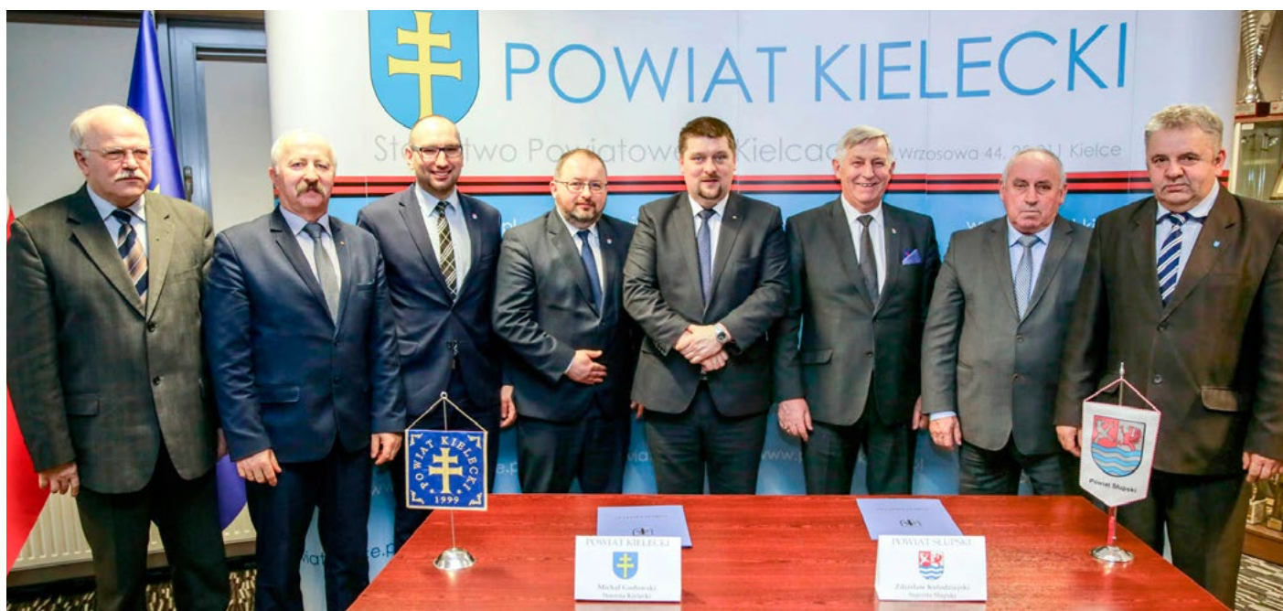
Przedstawiciele dwóch powiatów – kieleckiego oraz słupeckiego.