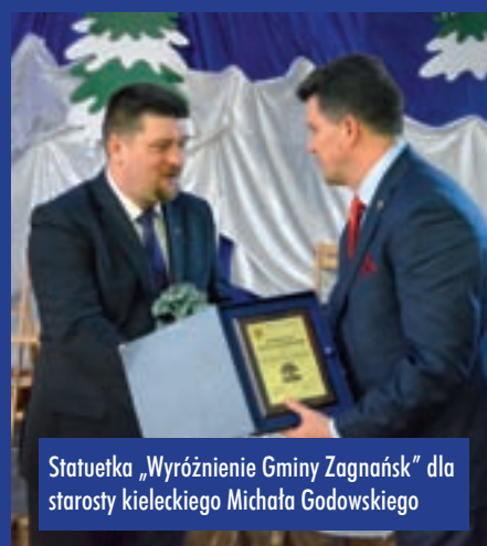
Statuetka „Wyóżnienie Gminy Zagnańsk” dla starosty kieleckiego Michała Godowskiego