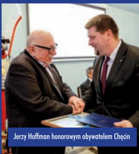
Jerzy Hoffman honorowym obywatelem Chęciny