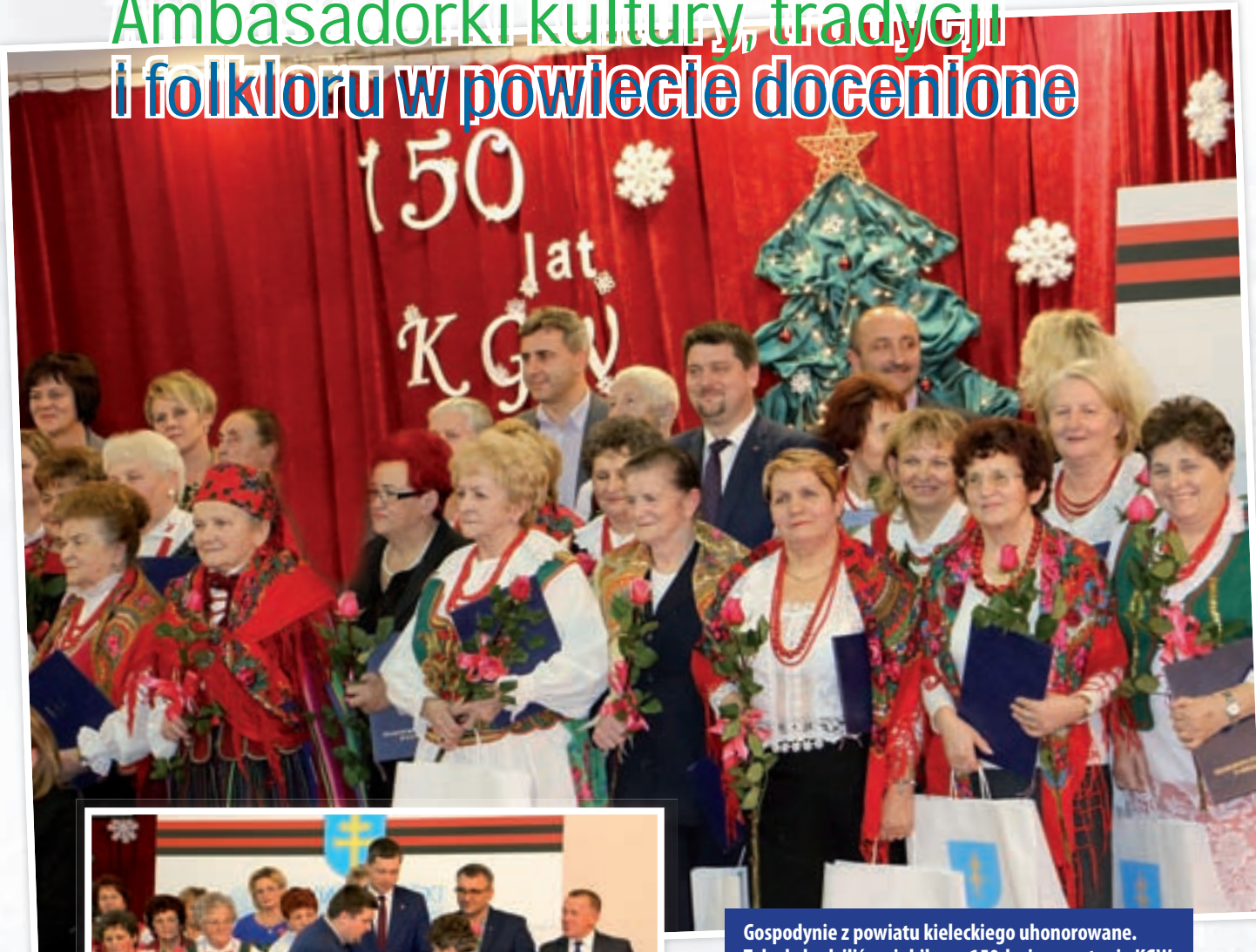
Gospodynie z powiatu kieleckiego uhonorowane. Tak obchodziliśmy jubileusz 150-lecia powstania KGW.