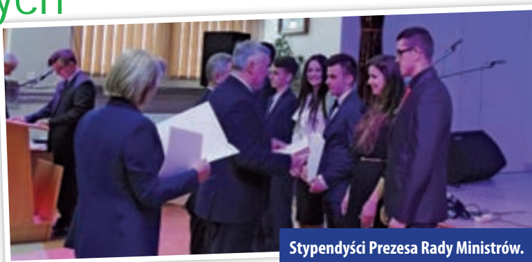
Stypendyści Prezesa Rady Ministrów.

Siedmiu uczniów powiatowych szkół ponadgimnazjalnych odebrało Stypendia Prezesa Rady Ministrów.