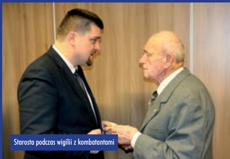
Starosta podczas wigilii z komatantami