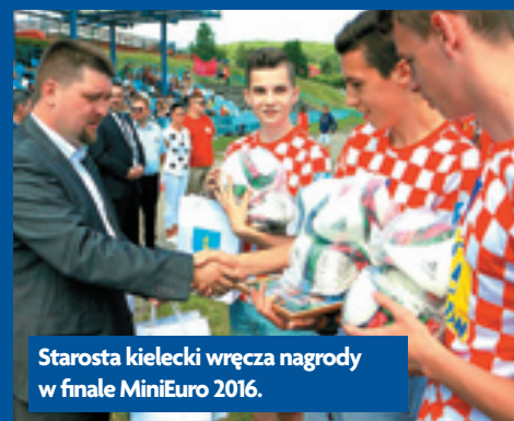
Starosta kielecki wręcza nagrody w finale MiniEuro 2016.