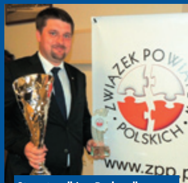
Starosta odbiera Puchar dla najlepszego powiatu w rankingu Związku Powiatów Polskich.