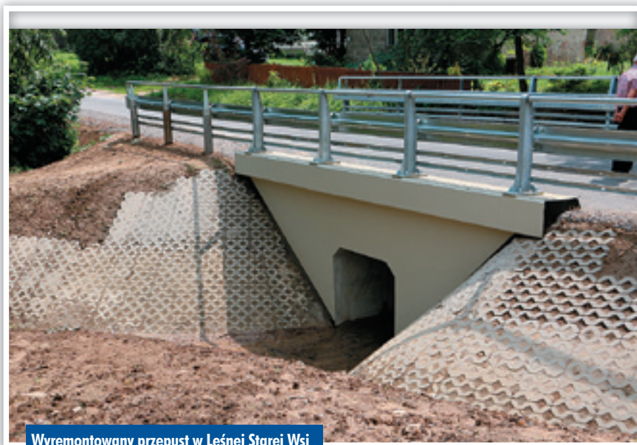
Wyremontowany przepust w Leśnej Starej Wsi

Wcześniej z budżetu MSWiA na remont dróg powiatowych uszkodzonych w minionych latach przez nawalne deszcze powiat pozyskał 821 tys. zł,