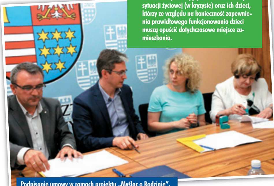
Podpisanie umowy w ramach projektu „Myśląc o Rodzinie”.