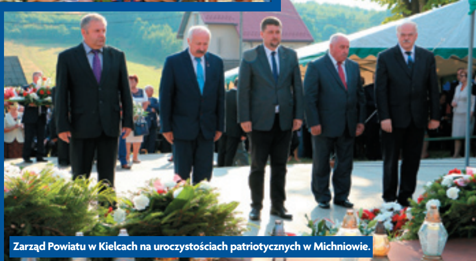
Zarząd Powiatu w Kielcach na uroczystościach patriotycznych w Michniowie.