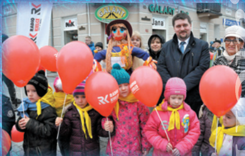
Starosta kielecki z dziećmi podczas budzenia wiosny.