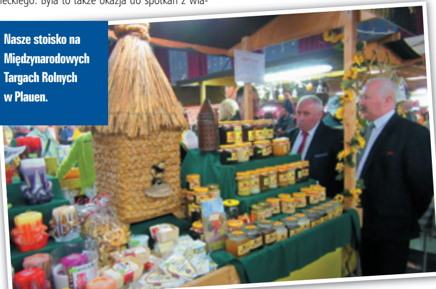
Nasze stoisko na Międzynarodowych Targach Rolnych w Plauen.