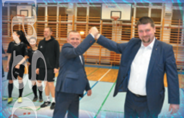
Powiat kielecki w dobrych rękach.