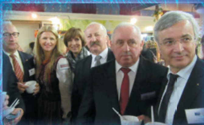
Nasza delegacja na targach w Plauen.