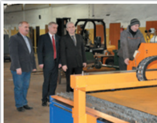
Wizyta w CKPiU