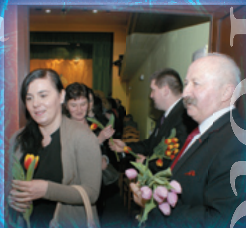
Nasza władza uczęła Dzień Kobiet w Chmielnickim Centrum Kultury.