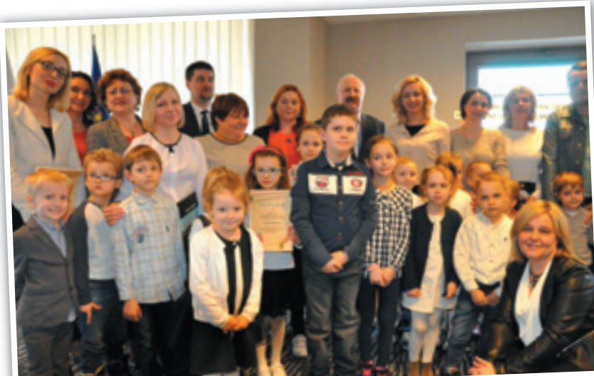
Laureaci XII edycji konkursu „Dla Ziemi, dla siebie” – „Chcemy oddychać czystym powietrzem”