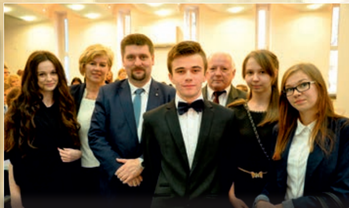
Stypendyści Prezesa Rady Ministrów z powiatowych szkół w Chmielniku i Łopusznie