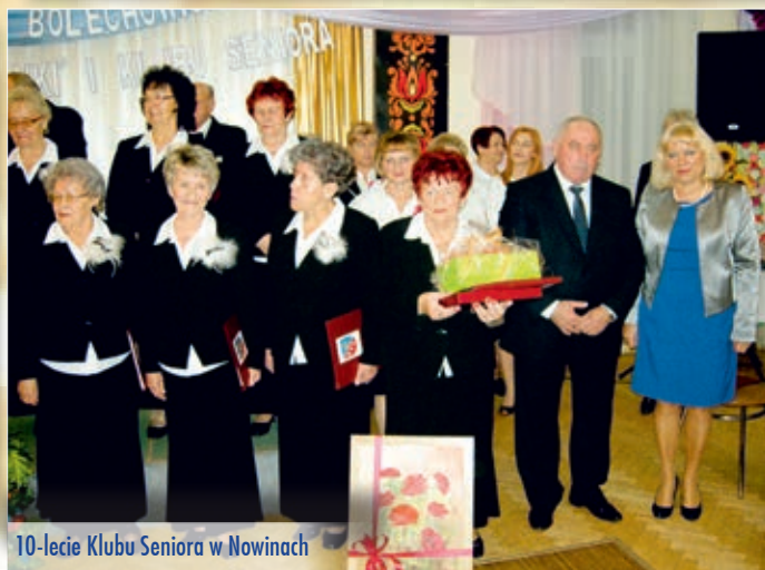
10-lecie Klubu Seniora w Nowinach