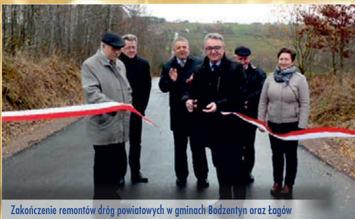
Zakończenie remontów dróg powiatowych w gminach Bodzentyn oraz Łagów