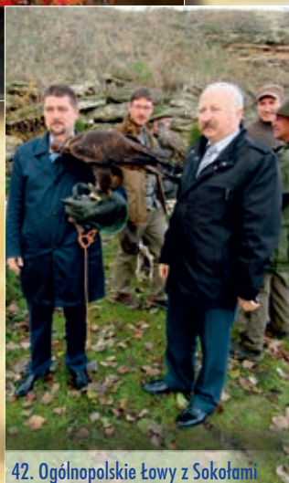
42. Ogólnopolskie Łowy z Sokołami