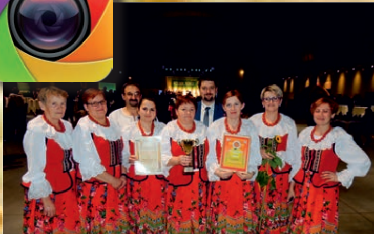
Najlepsze Koło Gospodyń Wiejskich 2015 - „Wolanie z Woli Łagowskiej