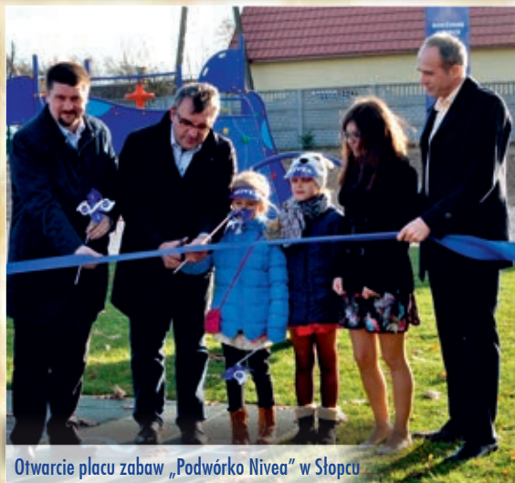
Otwarcie placu zabaw „Podwórko Nivea” w Słopcu