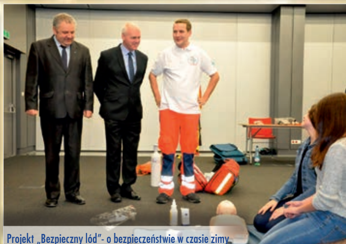
Projekt „Bezpieczny łód”- o bezpieczeństwie w czasie zimy