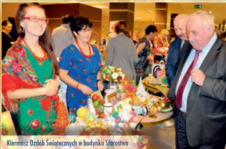
Kiermasz Ozdób Świątecznych w budynku Starostwa