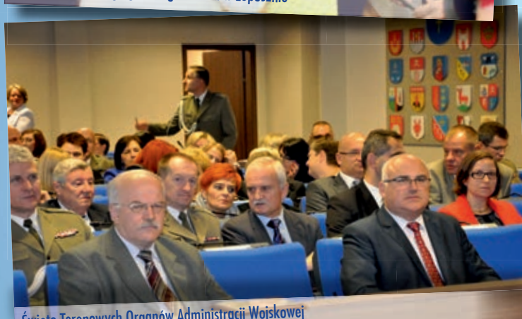
Święto Terenowych Organów Administracji Wojskowej