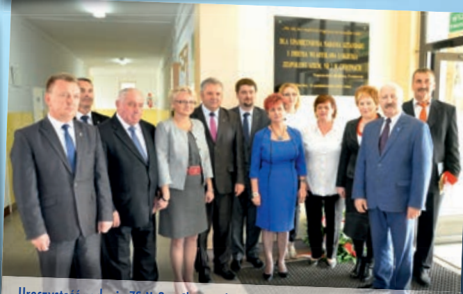
Uroczystość nadania ZS Nr2 w Chęcinach imienia Władysława Łokietka