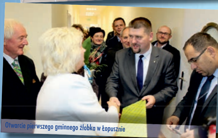
Otwarcie pierwszego gminnego żłobka w Łopusznie