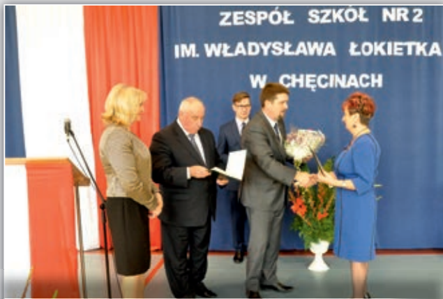
Uroczystości nadania im. Władysława Łokietka ZS Nr 2 w Chęcinach.

16 października był dniem niezwykle ważnym dla społeczności uczniowskiej, grona pedagogicznego Zespołu Szkół Nr 2. Tego dnia placówce wręczono sztandar i nadano imię Władysława Łokietka.