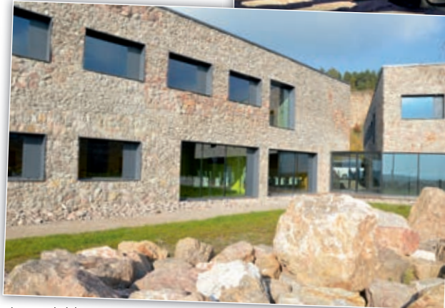
Chęciny - dodal.