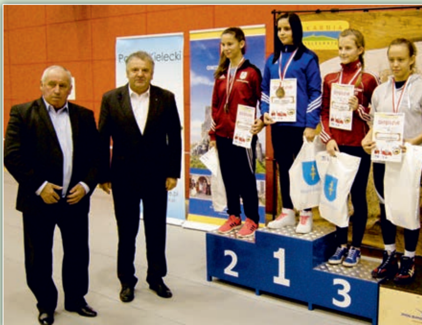
Puchar Polski Juniorek i Kadetek w zapasach kobiet w Chęcinach.