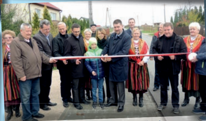
Uroczyste oddanie do użytku nowego chodnika w Nidzie, gm. Morawica