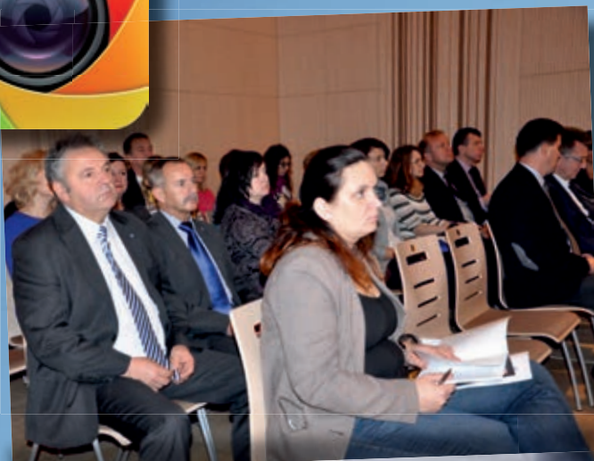
IX Kongres Stowarzyszeń Województwa Świętokrzyskiego