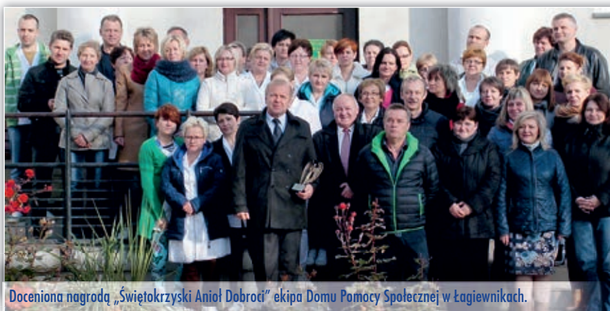
Doceniona nagrodą „Świętokrzyski Anioł Dobroci” ekipa Domu Pomocy Społecznej w Łagiewnikach.