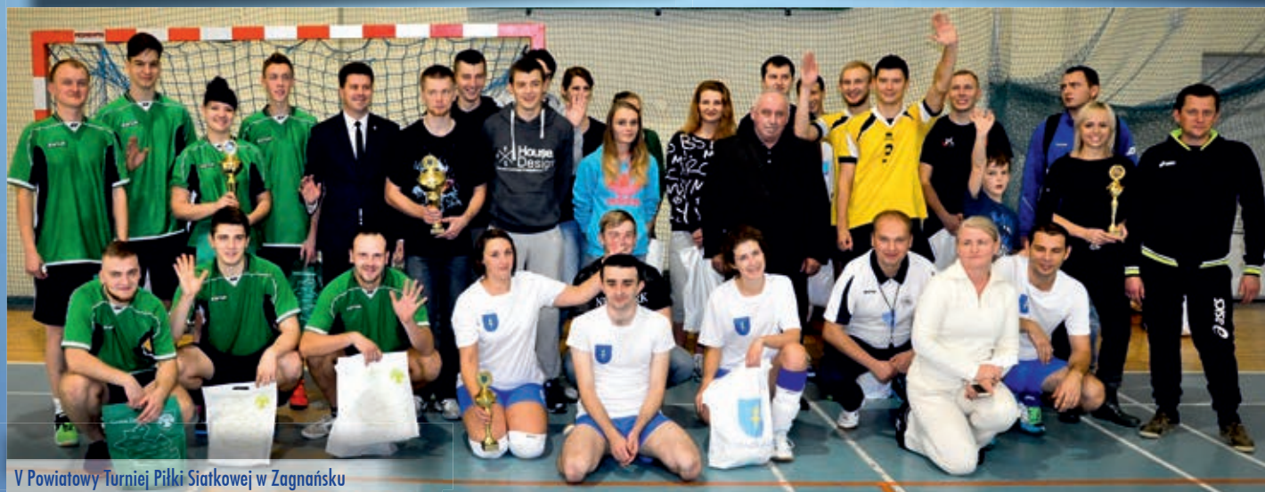
V Powiatowy Turniej Piłki Siatkowej w Zagnańsku