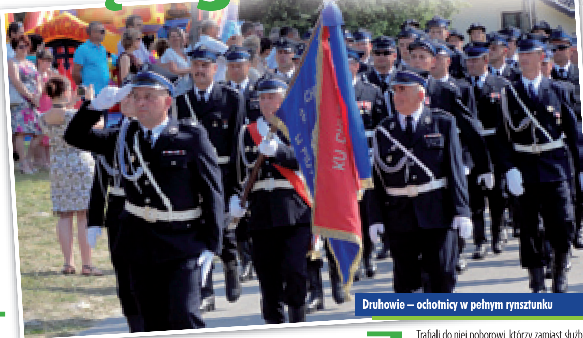
Druhowie – ochotnicy w pełnym rynsztunku

Ludzie różnych stanów społecznych, zawodów i wyznań religijnych – połączyło ich jedno – poświęcenie, pomoc bliźniemu i walka z ogniem.