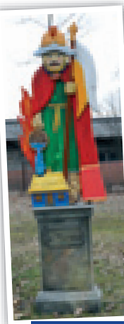
Zabytkowy pojazd strażacki z lat 70. XX w. i figura św. Floriana ze skansenu w Tokarni

Ważnym wydarzeniem w pierwszych latach funkcjonowania w Kielcach straży ogniowej było utworzenie or-