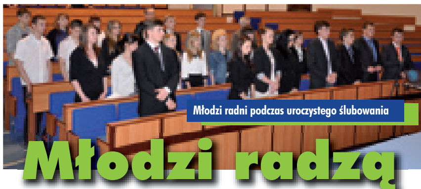
Młodzi radni podczas uroczystego ślubowania