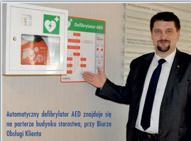
Automatyczny defibrylator AED znajduje się na parterze budynku starostwa, przy Biurze Obsługi Klienta

To nie jedyne udogodnienie dla klientów – w Starostwie Powiatowym dostępny jest pokój matki z dzieckiem. Można w nim przewinąć niemowlę i nakarmić je w dogodnych warunkach. W pomieszczeniu znajduje się przewijak i osobna toaleta, można zamknąć je na klucz. Z pokoju mogą skorzystać wszystkie matki, które załatwiają swoje sprawy w urzędzie. Pomieszczenie znajduje się na parterze urzędu, klucz dostępny jest w portierni. (em)