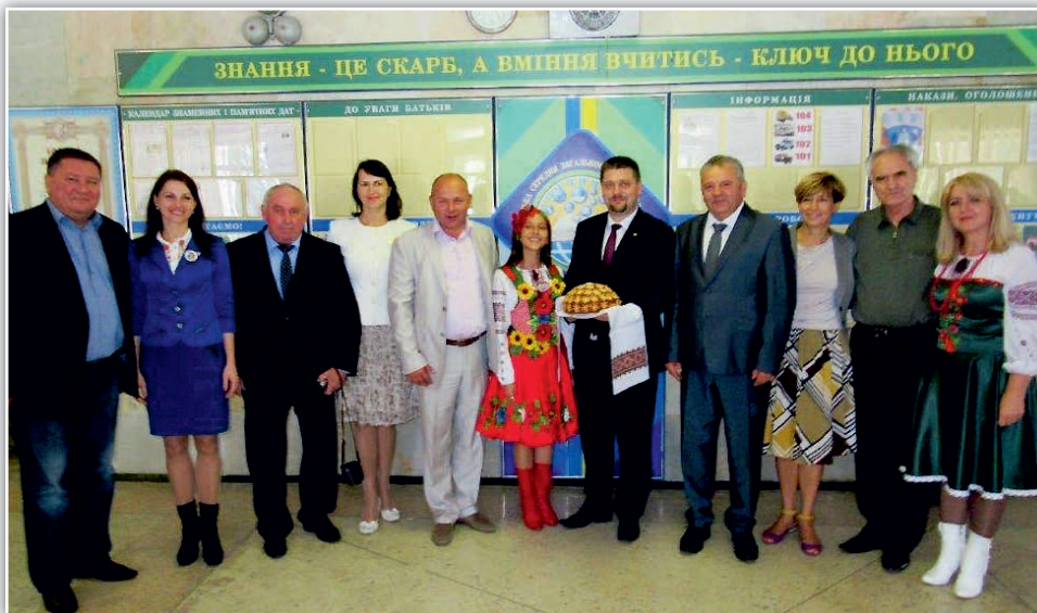
Delegacja powiatu kieleckiego na Ukrainie.

— Podczas wizyty odbyliśmy szereg spotkań z przedstawicielami władz obwodu