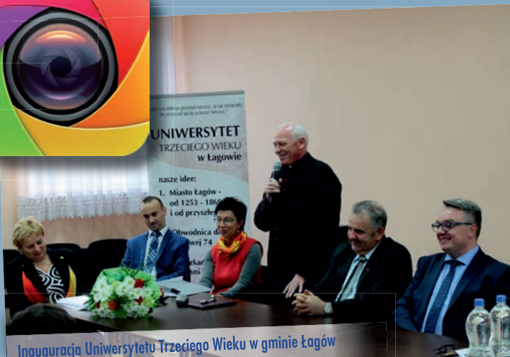
Inauguracja Uniwersytetu Trzeciego Wieku w gminie Łągowo