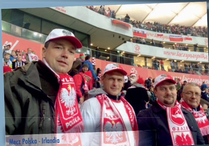
Mecz Polska - Irlandia