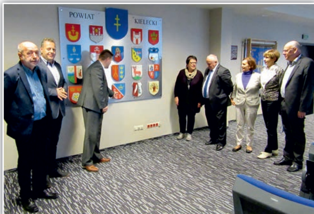
Współpraca w zakresie leczenia była głównym tematem rozmów władz powiatu kieleckiego z delegacją powiatu Vogtland w Saksonii.