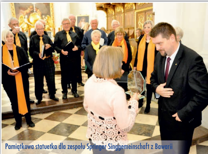
Pamiątkowa statuetka dla zespołu Springer Singgemeinschaft z Bawarii