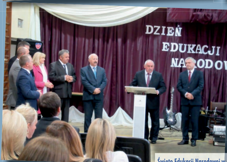
Święto Edukacji Narodowej w szkołach powiatowych