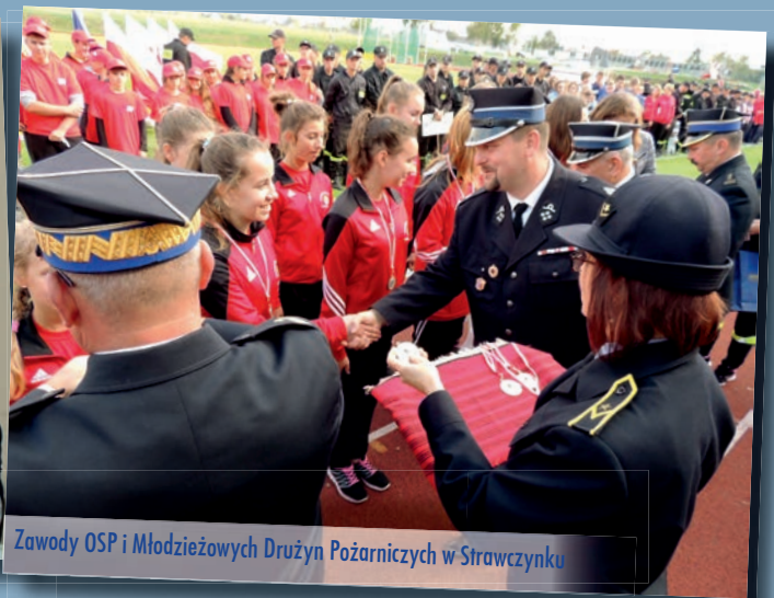
Zawody OSP i Młodzieżowych Drużyn Pożarniczych w Strawczynku