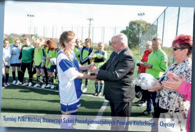
Turniej Piłki Nożnej Dziewcząt Szkół Ponadgimnazjalnych Powiatu Kieleckiego - Chęciny