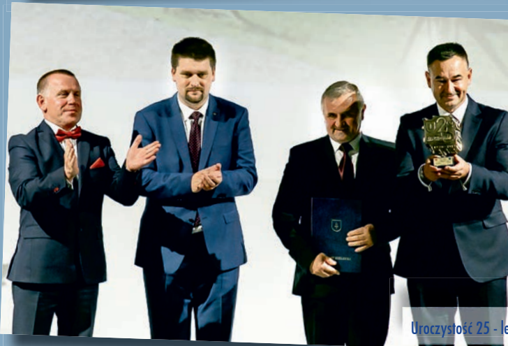
Uroczystość 25 - lecia Samorządu