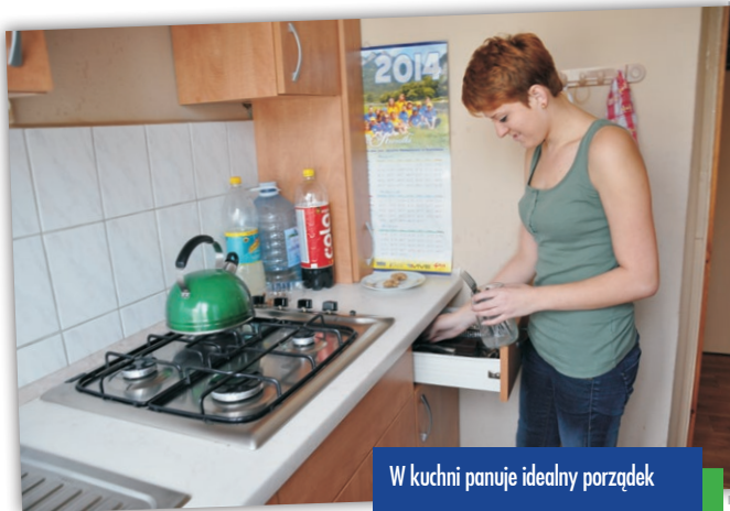
W kuchni panuje idealny porządek

W kuchni panuje idealny porządek. Młodzi ludzie sami gotują sobie posiłki,