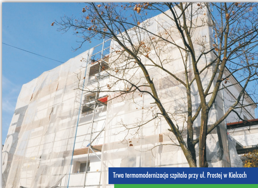
Trwa termomodernizacja szpitala przy ul. Prostej w Kielcach

Szpital Powiatowy w Chmielniku przygotowuje z własnych środków projekt adaptacji pomieszczeń po starym bloku operacyjnym, pracowni RTG i izbie przyjęć. – Powstaną tam sale chorych – informuje Jolanta Rybczyk, dyrektor szpitala. ■