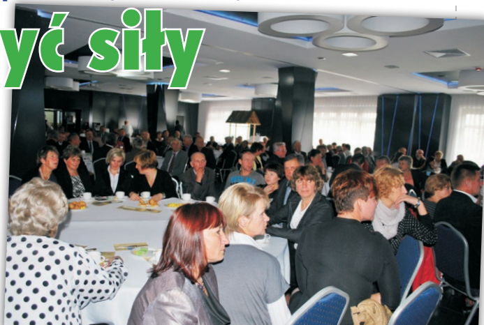
W dorocznym spotkaniu tłumnie wzięli udział sołtysi i samorządowcy z powiatu kieleckiego

Na spotkaniu sołtysów nie zabrakło przedstawicieli policji, Kasy Rolniczego Ubezpieczenia Społecznego oraz Państwowej Inspekcji Pracy, którzy przypominali o tym, jak zachować bezpieczeństwo na wsi.