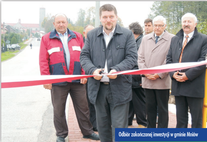
Odbiór zakończonej inwestycji w gminie Mniów

oraz ponad 120-metrowy w Drugni. Łącznie powiat wydał blisko 100 tys. zł, z czego 40 tys. zł dołożyła gmina Pierzchnica. Odebrano też 2,5 km odcinek Bieliny – Makoszyn, gdzie poszerzono jezdnię i położono nową nawierzchnię. Koszt to 1 mln 280 tys. zł, z czego 80 proc. to dofinansowanie z Ministerstwa Administracji i Cyfryzacji. Odebrano też drogę powiatową Bardo-Sadków – ponad 2-kilometrowy od-