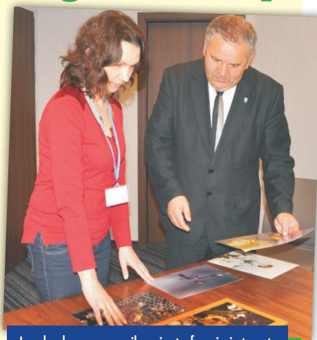
Jury konkursowe oceniło m.in. trafne ujęcie tematu

Wręczenie nagród nastąpi 27 maja o godz. 10