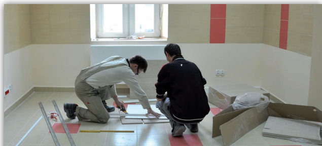
W szpitalu przy ul. Prostej trwa remont dyżurek i gabinetów zabiegowych oddziału położniczego

Zakup sprzętu medycznego, prace remontowe, nowe poradnie – powiatowe placówki służby zdrowia wykorzystują każdą złotówkę, by unowocześnić swoją bazę.