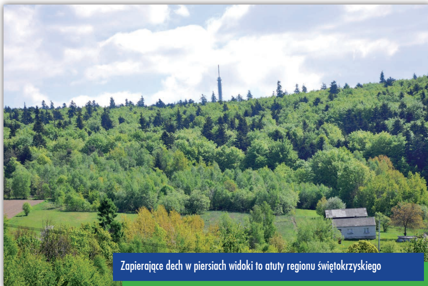
Zapierające dech w piersiach widoki to atuty regionu świętokrzyskiego

Świętokrzyski Sztetl w Chmielniku, zespół pałacowy w Podzamczu, Szklany Dom w Ciekotach, Osada Średniowieczna w Hucie Szklanej... Na mapie turystycznej powiatu kieleckiego wyrastają nowe, chętnie odwiedzane przez gości, atrakcje. Chciałoby się powiedzieć – oby tak dalej.