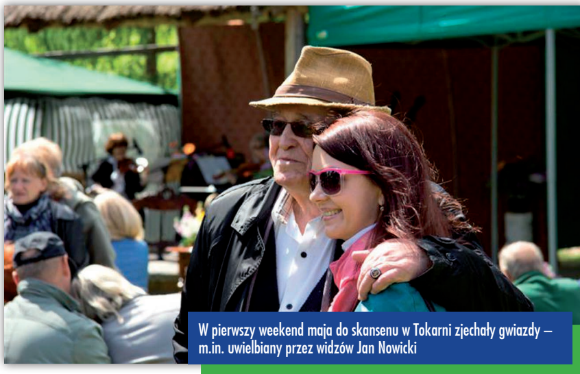
W pierwszy weekend maja do skansenu w Tokarni zjechały gwiazdy – m.in. uwielbiany przez widzów Jan Nowicki

dane z Ośrodka Edukacyjnego ŚPN w Bodzentynie – ponad 3 tys. zwiedzających.