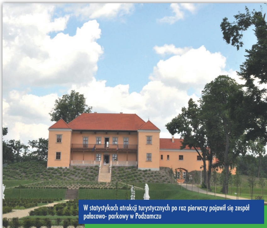
W statystykach atrakcji turystycznych po raz pierwszy pojawił się zespół pałacowo-parkowy w Podzamczu

Wokół Świętego Krzyża i Gór Świętokrzyskich rodzą się coraz to nowe inicjatywy, które mają te sztafety miejsca naszego regionu uczynić jeszcze atrakcyjniejszymi. Warto przywołać tu dane z rankingu Urzędu Marszałkowskiego – Świętokrzyski Park Narodowy odwiedziło w ubiegłym roku 171 tys. 639 osób. To niestety mniej niż w 2012 r. Szlakami turystycznymi Świętokrzyskiego Parku Narodowego wędrowało w 2013 r. ponad 136 tys. piechurów, a Muzeum Przyrodnicze odwiedziło 32 tys. osób. Po raz pierwszy w zestawieniu pojawiły się