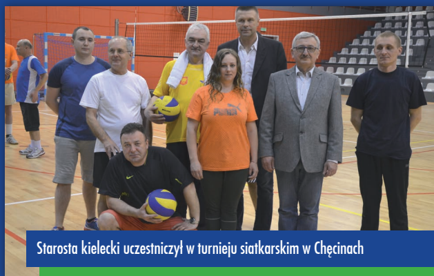
Starosta kielecki uczestniczył w turnieju siatkarskim w Chęcinach

Wielu tych przedsięwzięć by nie było, gdyby nie nowoczesne hale sportowe w Chmielniku, Chęcinach i Nowej Słupi które powiat dofinansował. Na halę w Nowej Słupi samorząd powiatu przeznaczył 1 mln 547 tys. zł, zaś na halę sportową w Chęcinach 2 mln 381 tys. zł. Agneszka Madetko