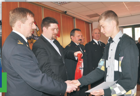
Nagrody w konkursie ufundowało Starostwo Powiatowe w Kielcach

Odbывая się każdego roku Ogólnopolskiego Turnieju Wiedzy Pożarniczej Młodzieży cieszy się ogromnym zainteresowaniem uczniów z powiatu kieleckiego. Muszą się oni wykazać ogromną wiedzą i refleksem. Podczas niedawnych eliminacji powiatowych wszyscy mieli do rozwiązania test, składający się z dwudziestu pytań. Wśród nich były