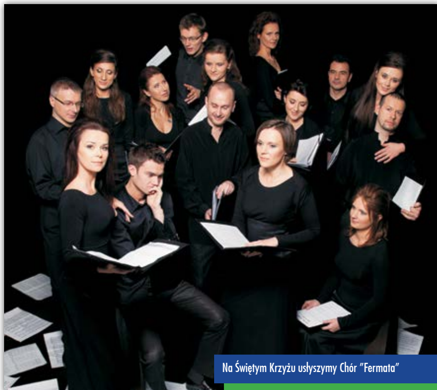
Na Świętym Krzyżu usłyszymy Chór „Fermata”