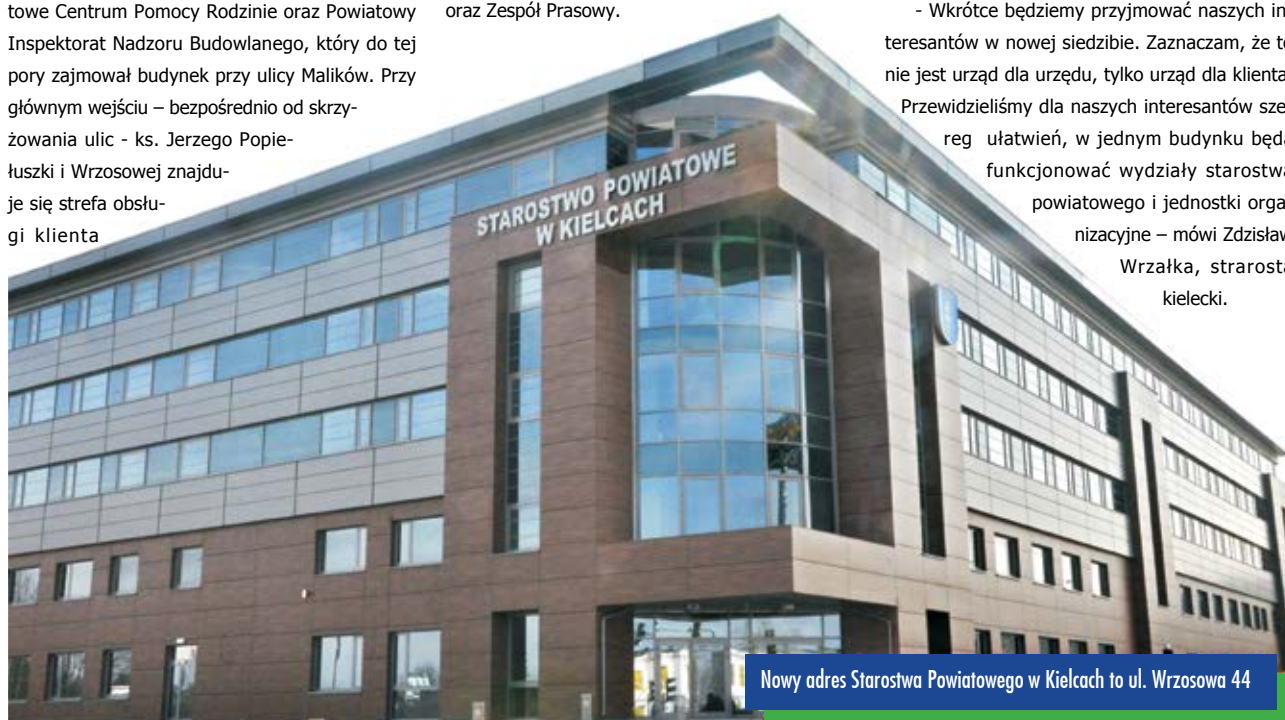
Nowy adres Starostwa Powiatowego w Kielcach to ul. Wrzosowa 44