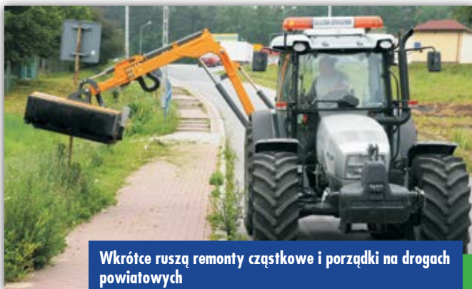
Wkrótce ruszą remonty cząstkowe i porządki na drogach powiatowych

[ Kilkadziesiąt kilometrów dróg powiatowych zostanie w tym roku naprawionych w ramach remontów cząstkowych. Wydamy na to ponad 472 tys. zł. ]