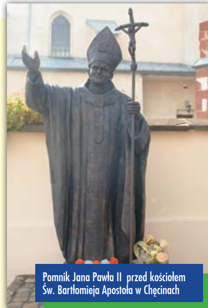
Pomnik Jana Pawła II przed kościołem Św. Bartłomieja Apostoła w Chęcinach