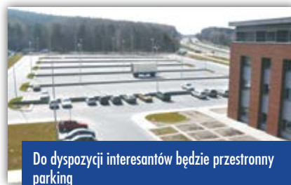
Do dyspozycji interesantów będzie przestronny parking

trzecim piętrze. Gabinety starosty kieleckiego i Zarządu Powiatu usytuowano na trzecim piętrze. Obok znajdziemy Biuro Rady Powiatu oraz Zespół Prasowy.