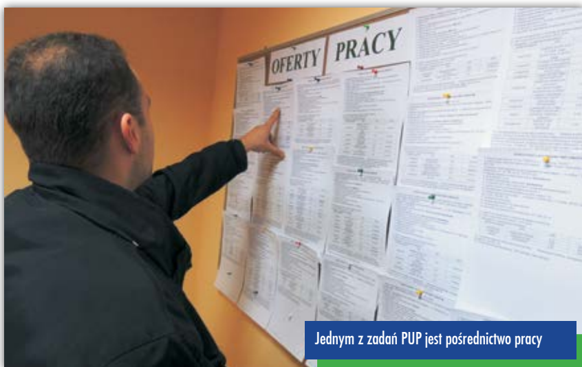
Jednym z zadań PUP jest pośrednictwo pracy

[ Powiatowy Urząd Pracy w Kielcach efektywnie sięga po narzędzia, które pozwalają walczyć z bezrobociem. ]