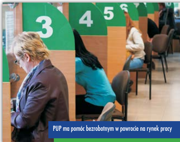
PUP ma pomóc bezrobotnym w powrocie na rynek pracy

- Osobom zwolnionym z pracy dedykujemy projekt „3P – czyli Przedsiębiorczy Pracujący Po-