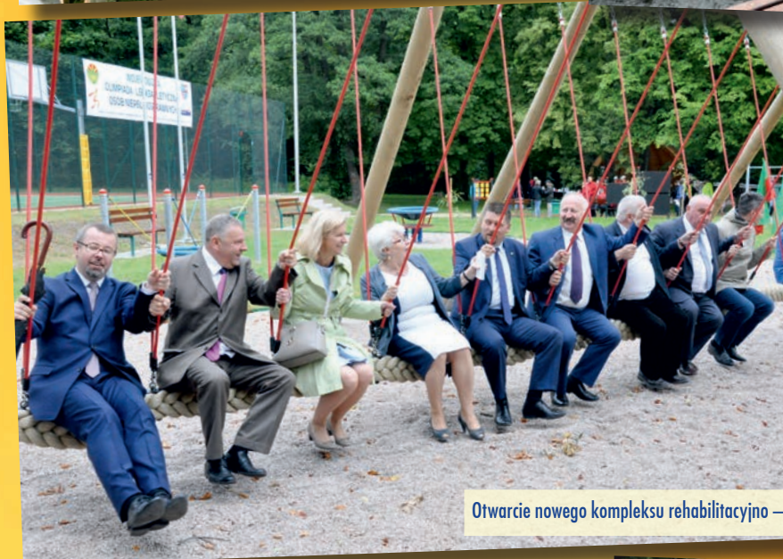
Otwarcie nowego kompleksu rehabilitacyjno – rekreacyjnego w DPS w Zgórsku