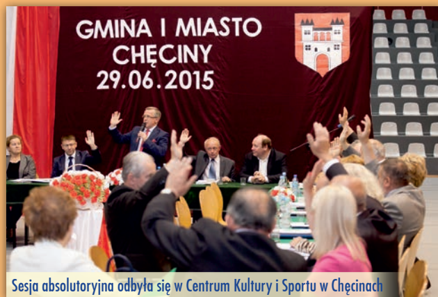
Sesja absolutorijna odbyła się w Centrum Kultury i Sportu w Chęcinach

Za udzieleniem absolutorium w imieniu radnych PO opowiedział się również radny