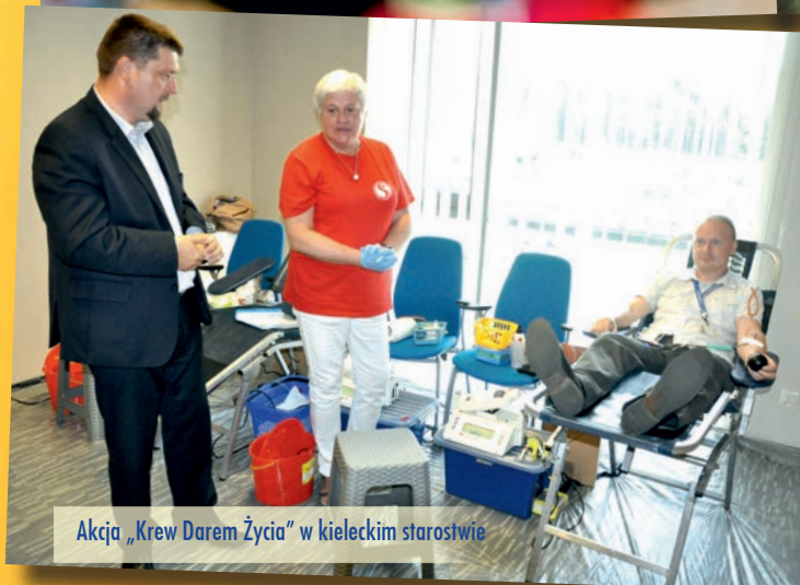
Akcja „Krew Darem Życia” w kieleckim starostwie