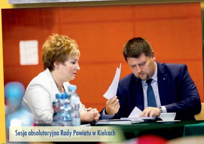
Sesja absolutoryjna Rady Powiatu w Kielcach