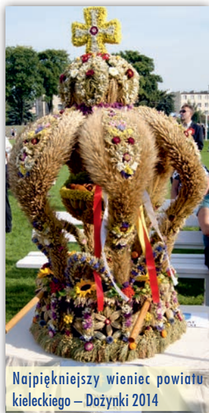
Najpiękniejszy wieniec powiatu kieleckiego – Dożynki 2014

Święto dziękczynienia za plony to okazja do wyrażenia wdzięczności, radości oraz dumy z pracy i wysiłku rolnika. Jest także wyrazem wdzięczności dla Boga za szczęśliwy zbiór plonów. To piękna, wielowiekowa i wymowna tradycja - bochen chleba wypieczony z tegorocznego ziarna