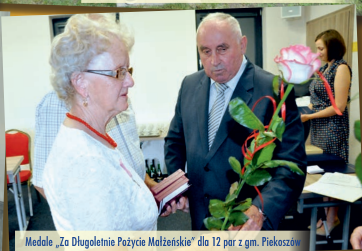
Medale „Za Długoletnie Pożycie Małżeńskie” dla 12 par z gm. Piekoszów