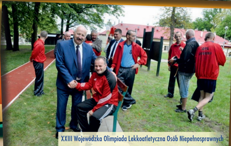
XXIII Wojewódzka Olimpiada Lekkoatletyczna Osób Niepełnosprawnych