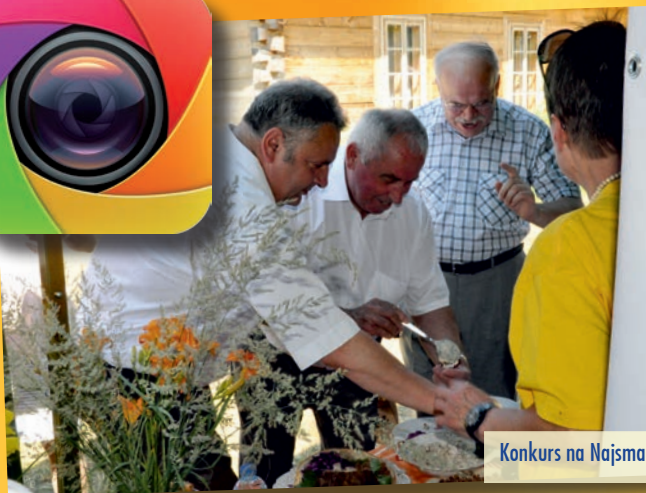
Konkurs na Najsmaczniejszą Potrawę Powiatu Kieleckiego