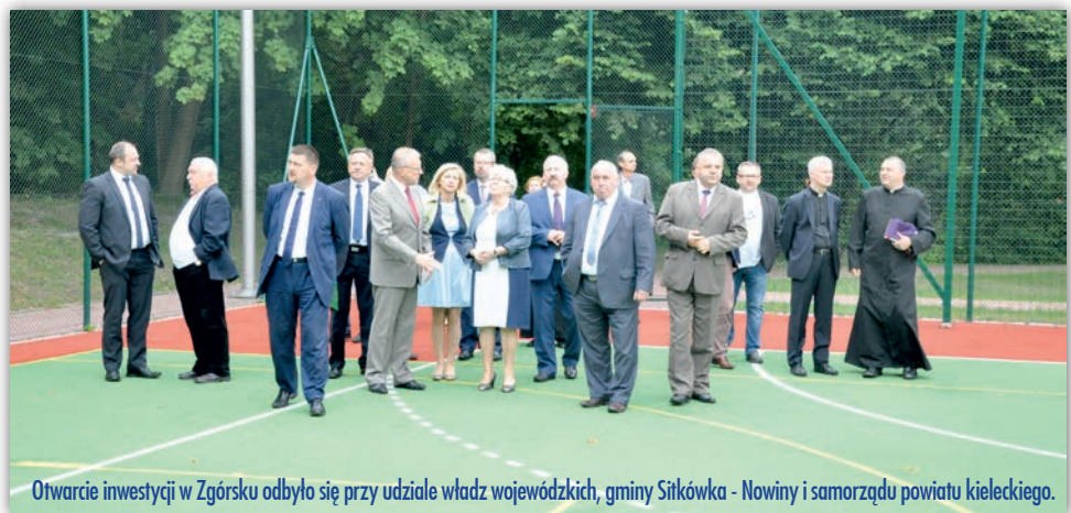
Otwarcie inwestycji w Zgórsku odbyło się przy udziale władz wojewódzkich, gminy Sitkówka - Nowiny i samorządu powiatu kieleckiego.

Budowę kompleksu rozpoczęto w październiku 2013 roku, a zakończono w czerw-