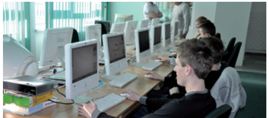
Mamy nowoczesne, dobrze wyposażone placówki oświatowe

– Uczestniczymy w projekcie „e-świętokrzyskie. Sieć Szerokopasmowa Polski Wschodniej”, który ułatwi dostęp do Internetu mieszkańcom powiatu