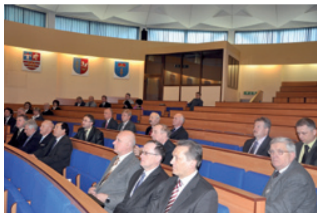
Radni powiatowi kadencji 2006-2010 podczas obrad