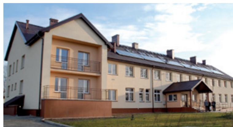
W powiecie kieleckim funkcjonują dwa Młodzieżowe Ośrodki Wychowawcze

Samorządowcy zgodnie twierdzą, że minione cztery lata to udany okres. Wystarczy spojrzeć jak zmienił się i jak wypiękniał powiat kielecki, ile cieka-