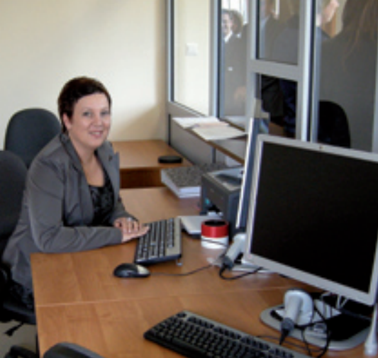
W tej kadencji samorządu otwarto siedem filii Wydziału Komunikacji. Na zdjęciu – filia w Bielinach