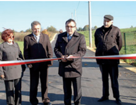
Otwarcie wyremontowanej drogi powiatowej w miejscowości Łąbędziów