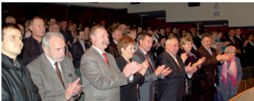
Podczas koncertu poświęconego S. Żeromskiemu sala WDK wypełniona była po brzegi.