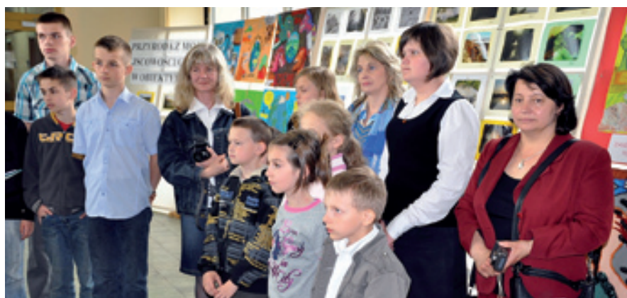
W konkursach ekologicznych organizowanych przez powiat kielecki chętnie biorą udział uczniowie ze szkół z gmin powiatu.

Konkursy plastyczne, zbiórka surowców wtórnych, wycieczka do oczyszczalni ścieków – to tylko niektóre z propozycji w ramach tegorocznej edycji programu ekologicznego „Dla Ziemi, dla siebie”.