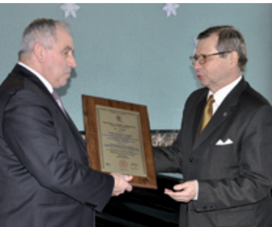
Starosta kielecki – Zenon Janus odbiera Certyfikat Systemu Zarządzania Bezpieczeństwem ISO 27001