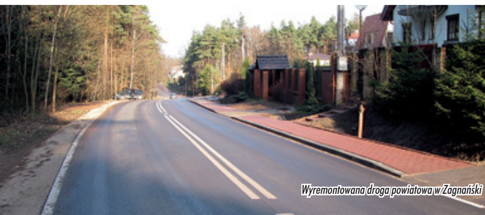
Wyremontowana droga powiatowa w Zagnańsku