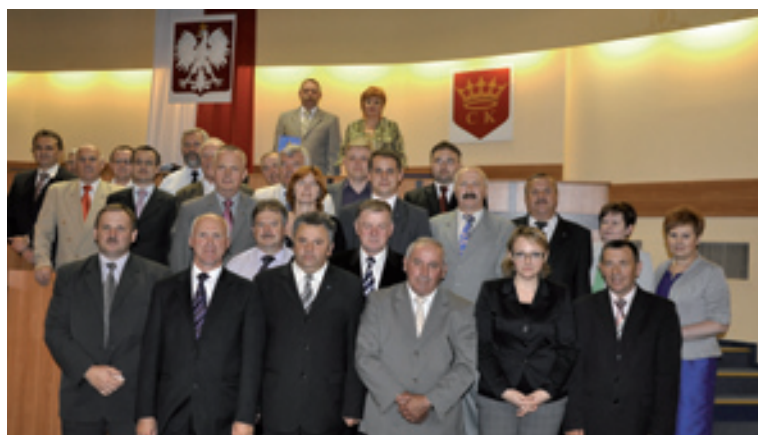
Radni powiatowi kadencji 2006-2010 wraz z Zarządem Powiatu w Kielcach

– To były pracowite lata, które zażyły się wieloma ważnymi inwestycjami. Oczywiście wielkie możliwości przed samorządami otworzyły unij-