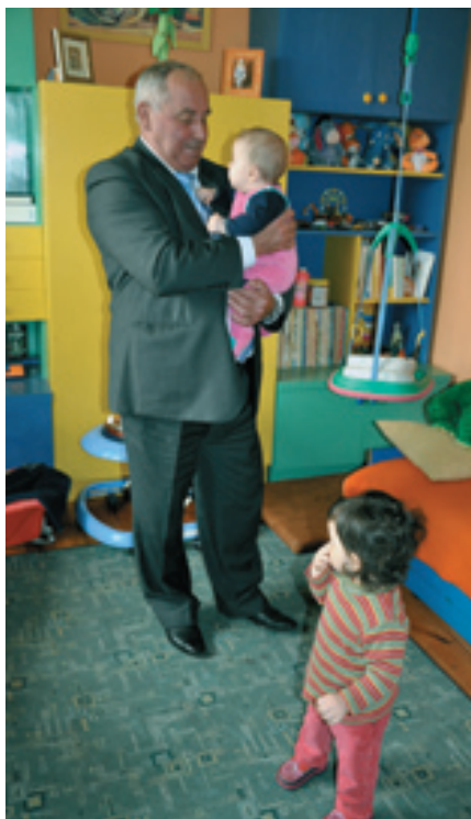
Starosta — Zenon Janus odwiedził wychowanków placówki opiekuńczych z terenu powiatu.

Zabawki, słodycze, maskotki, gry edukacyjne otrzymali z okazji Dnia Dziecka wychowankowie rodzinnych domów dziecka i zawodowych rodzin zastępczych, działających w powiecie kieleckim.