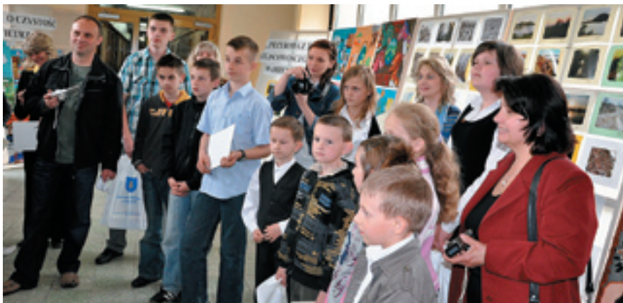
Uczniowie uczestniczący w konkursie zebrali 119 ton odpadów