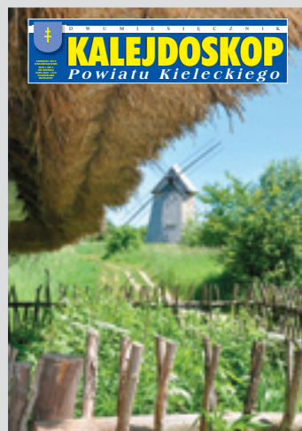
Na okładce: Park Etnograficzny w Tokarni.

Rozpowszechnianie wszelkich materiałów bez zgody Wydawcy jest zabronione. Egzemplarz gazety jest bezpłatny.