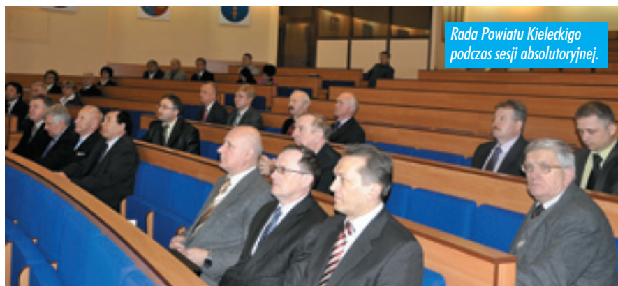
Rada Powiatu Kieleckiego podczas sesji absolutorijnej.

Radni przyjęli również informację o remontach i inwestycjach przeprowadzonych w 2009 r. na nieruchomościach będących w zasobach powiatu kieleckiego. Ogółem na inwestycje i remonty przeznaczono w ubiegłym roku 12 mln 629 tys. zł, z czego 7 mln pochodziło z budżetu powiatu. Natomiast inwestycje drogowe zamknęły się w kwocie 36 mln 791 tys. zł (w tym 11 mln 187 tys. zł — to środki własne powiatu, dofinansowanie z gmin — 12 mln 665 tys. zł, fundusze zewnętrzne — m.in. unijne — 12 mln 938 tys. zł). ■ (nieb.)