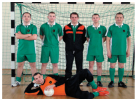
Drużyna piłkarska kieleckiego starostwa okazała się najlepsza podczas mistrzostw w piłce nożnej pracowników samorządowych