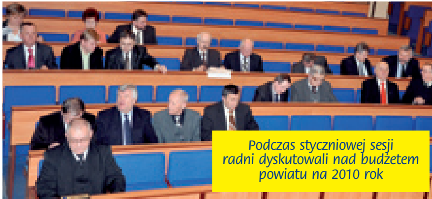
Podczas styczniowej sesji radni dyskutowali nad budżetem powiatu na 2010 rok

Budżet powiatu kieleckiego na 2010 r. przyjęto jednogłośnie podczas styczniowej sesji Rady Powiatu w Kielcach.