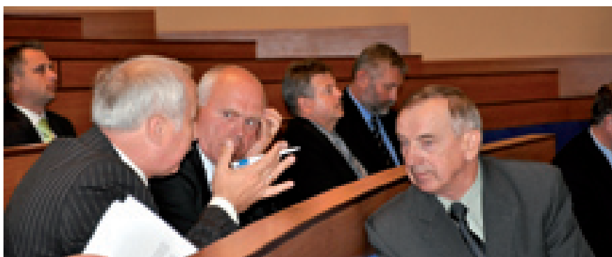
Dyskusja między radnymi Polskiego Stronnictwa Ludowego oraz Prawa i Sprawiedliwości

84 uchwały przegłosowała w ubiegłym roku Rada Powiatu Kieleckiego.