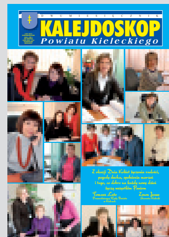
Na okładce. Pracownicy Starostwa Powiatowego w Kielcach.