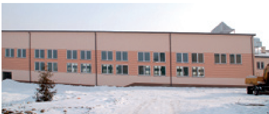
Tak prezentuje się nowa hala w Chmielniku, w której 13 lutego młodzież zatańczyła studniówkowego poloneza

W sierpniu 2009 r. ruszyła budowa obiektu w Nowej Słupii. Ma on być gotowy do września tego roku. Również ta inwestycja współfinansowana jest z Re-