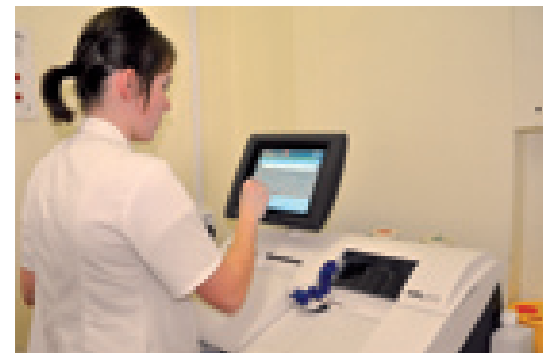
Nowoczesny sprzęt na wyposażeniu szpitala