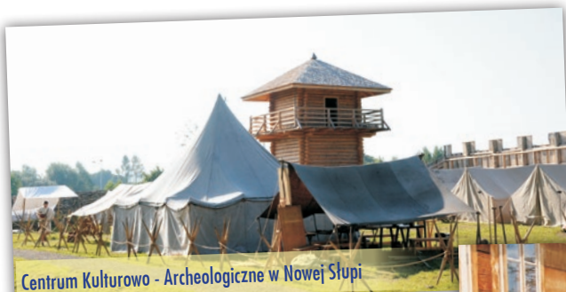
Centrum Kulturowo - Archeologiczne w Nowej Słupi

piotła, dyrektor Gminnego Ośrodka Kultury w Nowej Słupi.