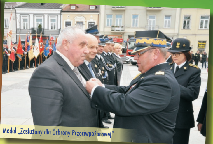
Medal „Zasłużony dla Ochrony Przeciwpożarowej”