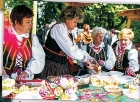
Degustacja specjalów przygotowanych przez panie z Kół Gospodyń Wiejskich.

Szczególne nawiązania do tradycji były motywem przewodnim całego wydarzenia, a w związku z Jubileuszem scenariusz zaplanowano w miejscu, gdzie wg klasztornej tradycji Świętego Krzyża odbywały się dawne jarmarki - na błoniach okalających klasztor od strony północnej. Atrakcji było bardzo wiele. Na dużym, malowniczo