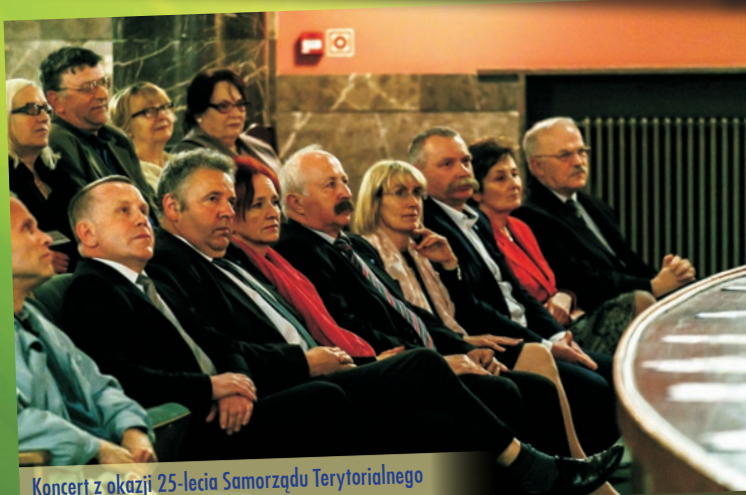
Koncert z okazji 25-lecia Samorządu Terytorialnego