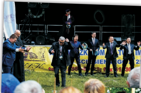
I Turniej Wójtów i Burmistrzów Powiatu Kieleckiego - na wesoło.