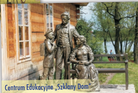
Centrum Edukacyjne „Szklany Dom”

Będąc w Podzamczu należy zobaczyć odrestaurowaną rezydencję Starostów Chęcińskich. W pobliżu dworcu znajdują się stawy oraz przepiękny barokowy ogród w stylu włoskim. Jednym z ciekawszych elementów tuż obok ogrodów jest barokowa brama Jana III Sobieskiego w formie