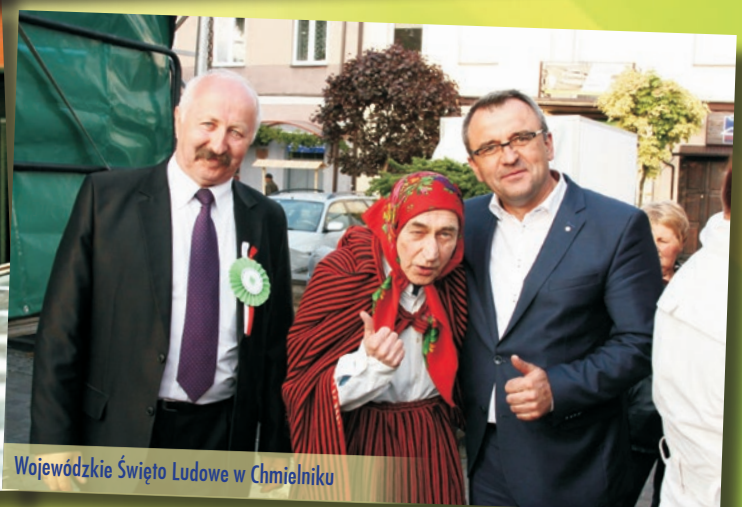
Wojewódzkie Święto Ludowe w Chmielniku