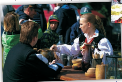
Uczestnicy Jarmarku mogli skosztować przepysznych, regionalnych potraw i wyrobów naturalnych.

W tym roku przygotowane zostało wyjątkowe rocznicowe widowisko w lekkiej konwencji zabawy i dowcipu oraz w klimacie tradycyjnych jarmarków śre-