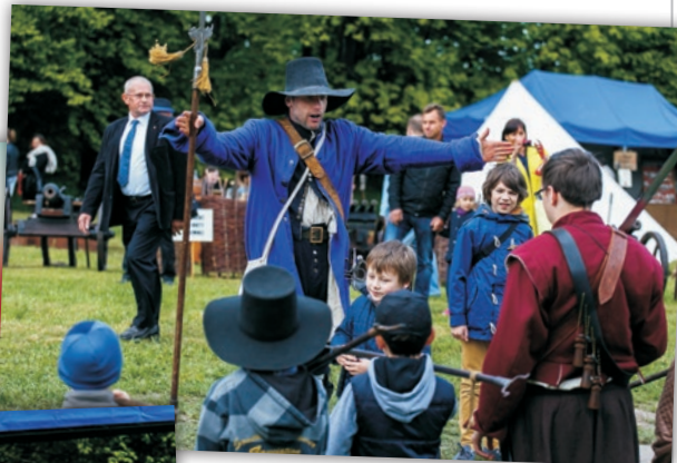
Regiment Piechoty Najemnej w strojach z epoki i zabawy dla najmłodszych uczestników.

Szczególne nawiązania do tradycji były motywem przewodnim całego wydarzenia, a w związku z Jubileuszem scenariusz zaplanowano w miejscu, gdzie wg klasztornej tradycji Świętego Krzyża odbywały się dawne jarmarki - na błoniach okalających klasztor od strony północnej. Atrakcji było bardzo wiele. Na dużym, malowniczo