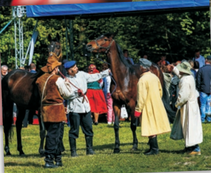
Liłkup - barwny pokaz zakupu konia wraz z tradycyjnymi, jarmarczynami dobijania targu.

Uroczystość rozpoczął tradycyjny ludowy sygnał województwa świętokrzyskiego „Da Moja tysico”, po czym procesja z relikwiami Krzyża Świętego przeszła do ołtarza polowego. Oprawę muzyczną mszy św. uświetniły chóry Sabaton z Bielin i Con Pasione z Zagnańska oraz Gminna Orkiestra Dęta ze Strawczyzna. Po mszy i wyprowadzeniu relikwii uczestnicy w kolorowym korowodzie przeszli pod scenę