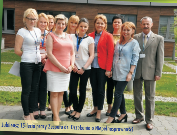
Jubileusz 15-lecia pracy Zespołu ds. Orzekania o Niepełnosprawności