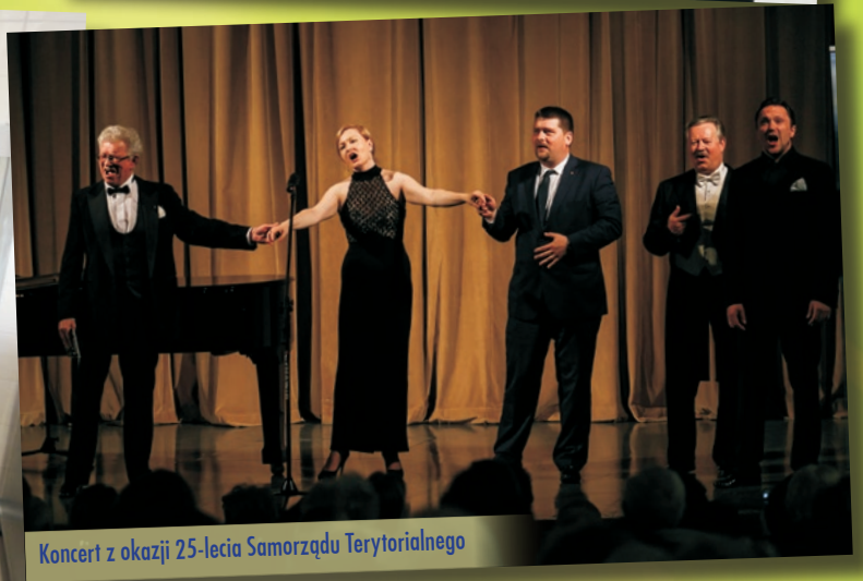
Koncert z okazji 25-lecia Samorządu Terytorialnego