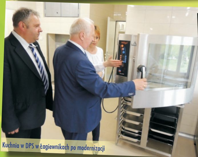
Kuchnia w DPS w Łagiewnikach po modernizacji