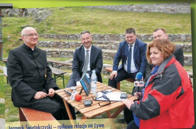
Jarmark Świętokrzyski – radiowa relacja na żywo