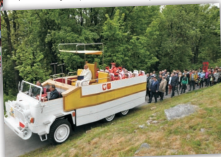
Procesja z relikwiami Krzyża Świętego do ołtarza polowego wraz z „Papamobile” - pojazdem, którym Ojciec Święty Jan Paweł II odbywał pielgrzymki po Polsce.

Warto zaznaczyć, że odbywający się co roku na Świętym Krzyżu Jarmark Świętokrzyski, którego głównym organizatorem jest Starostwo Powiatowe w Kielcach, już na stałe wpisał się w kalendarz kulturalny naszego regionu. Każdego roku przyciąga coraz większe rzesze turystów i pielgrzymów nie tylko z naszego województwa, ale i całej Polski.