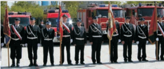
Święto strażaków to okazja do zaprezentowania osiągnięć straży czy też nowego sprzętu.

W 2011 roku powiat kielecki wsparł straż pożarną w kwocie 177 tys. zł. Z tej kwoty 74 tys. przeznaczono na zakup sorbentów i pomp szlamowych, a pozostałą jej część na zakup samochodu. W kolejnym roku na pompy i sorbenty z budżetu powiatu wydatkowano ponad 81 tys. zł. Podobnie było w latach kolejnych, w 2013 – 164 tys. przeznaczono na sorbenty, motopompy i samochód.