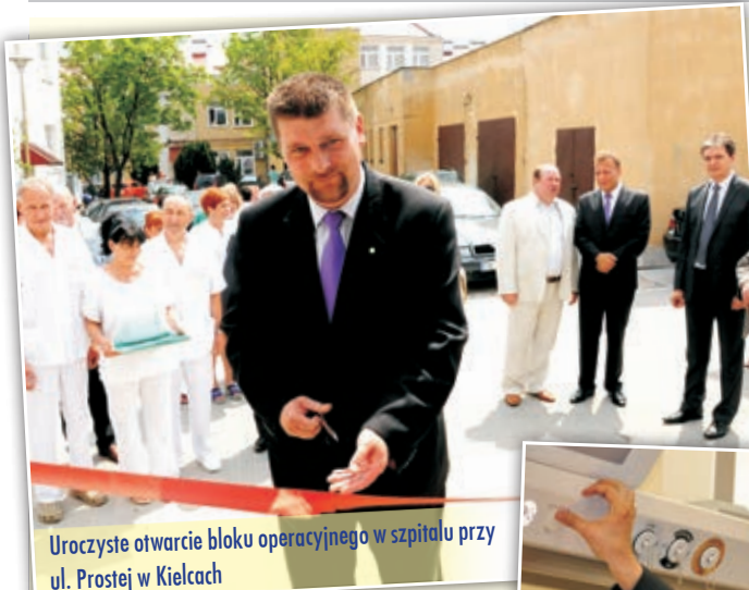
Uroczyste otwarcie bloku operacyjnego w szpitalu przy ul. Prostej w Kielcach

W latach 2004-2014 województwo świętokrzyskie otrzymało 12 miliardów 225 milionów złotych unijnych środków z przeznaczeniem na rozwój regionu. Pieniądże wykorzystano na różne cele, np. budowę szpitali, szkół, przedszkoli, uczelni wyższych, na modernizację rolnictwa i rozwój regionalnej gospodarki poprzez inwestycje w przedsiębiorstwach i wspieranie zakładania własnych firm. Przede wszystkim jednak na budowę infrastruktury dróg i mostów oraz wodociągów i kanalizacji. Budowa i rozwój infrastruktury drogowej były jednymi z głównych zadań, jakie Polska musiała zrealizować po dołączeniu do Unii Europejskiej. Właśnie to miało pozwolić nam dogonić Europę oraz usprawnić polską gospodarkę. Przedsiębiorstwa chętniej inwestują czy lokują swoje siedziby tam, gdzie mogą liczyć na dobrą infrastrukturę oraz logistykę. Wygodne, szybkie drogi służą także rozwojowi turystyki.