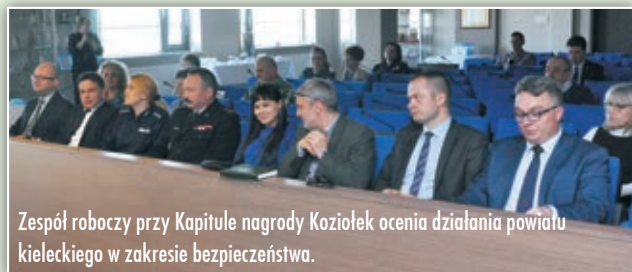
Zespół roboczy przy Kapitułe nagrody Koziołek ocenia działania powiatu kieleckiego w zakresie bezpieczeństwa.