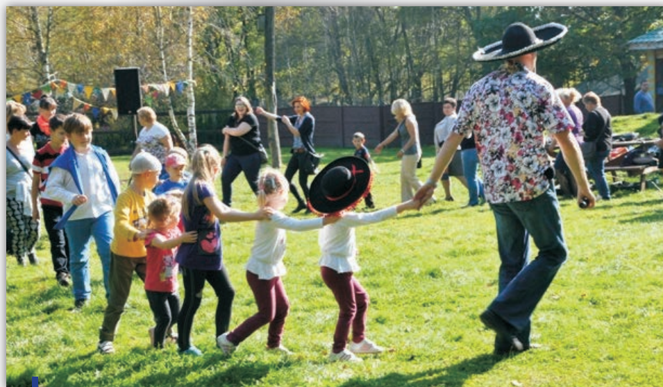
Dla dzieci z rodzin zastępczych i placówek opiekuńczo-wychowawczych zorganizowano piknik w ramach projektu „Równi lecz różni”, realizowanego przez PCPR w Kielcach