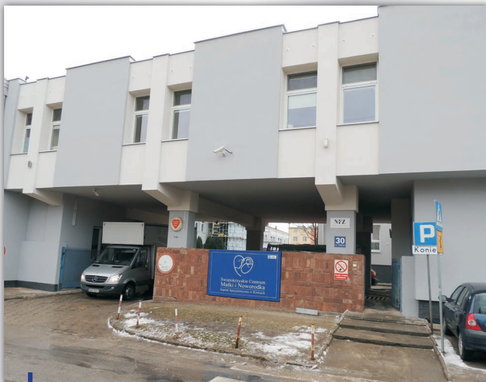
Dzięki unijnemu wsparciu szpital przy ul. Prostej przechodzi gruntowaną termomodernizację