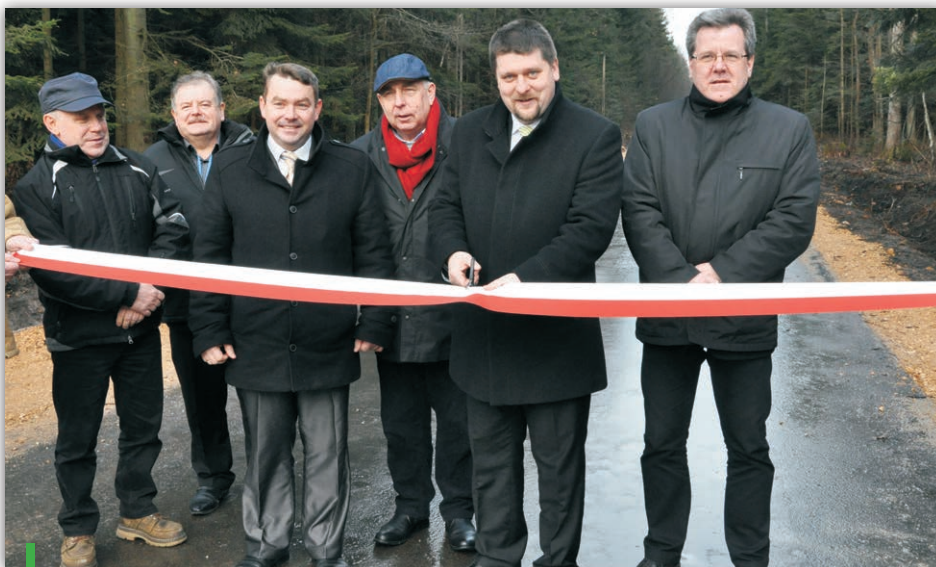
Odbiór drogi Szczecno – Ujny