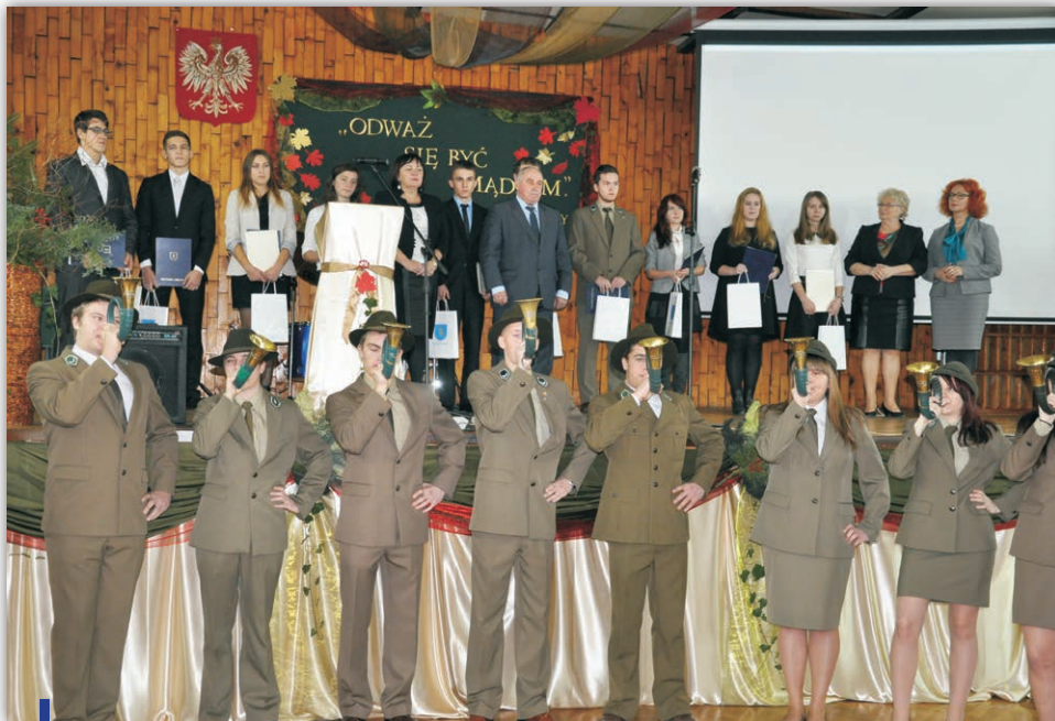
Stypendyści Prezesa Rady Ministrów z powiatu kieleckiego

W tym roku Stypendia Prezesa Rady Ministrów przyznano 142 uczniom z regionu świętokrzyskiego. Wszyscy oni otrzymali promocję z wyróżnieniem, mają najwyższą średnią ocen w szkole lub wykazują szczególne uzdolnienia w co najmniej jednej dziedzinie wiedzy, uzyskując w niej najwyższe wyniki.