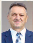
Mirosław Gębski starosta kielecki

Z okazji Świąt Bożego Narodzenia przesyłam najlepsze życzenia. Niech tegoroczne Święta będą jednymi z piękniejszych. Niech wspaniała atmosfera wigilijnej nocy, zapach choinki, wyczekiwana pierwsza gwiazdka i cichutko płynące dźwięki najpiękniejszych kolęd, przyniosą chwile zadumy i wzruszenia, ale też radości wynikającej z obecności najbliższych. A nadchodzący Nowy Rok niech przyniesie zdrowie, pomyślność i same szczęśliwe chwile. Wesołych Świąt Bożego Narodzenia!