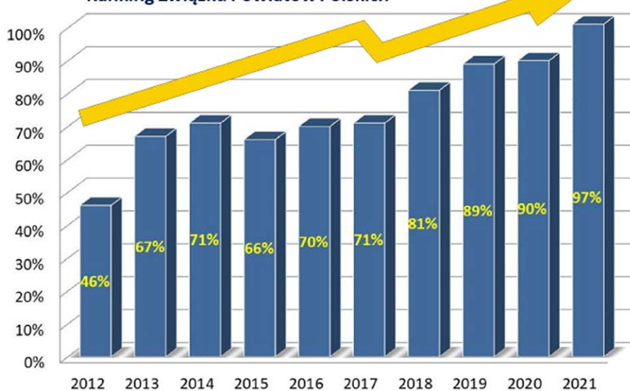
Ranking Związku Powiatów Polskich

% WYPEŁNIONYCH KRYTERIÓW W RANKINGU ZWIĄZKU POWIATÓW POLSKICH W LATACH 2012–2021