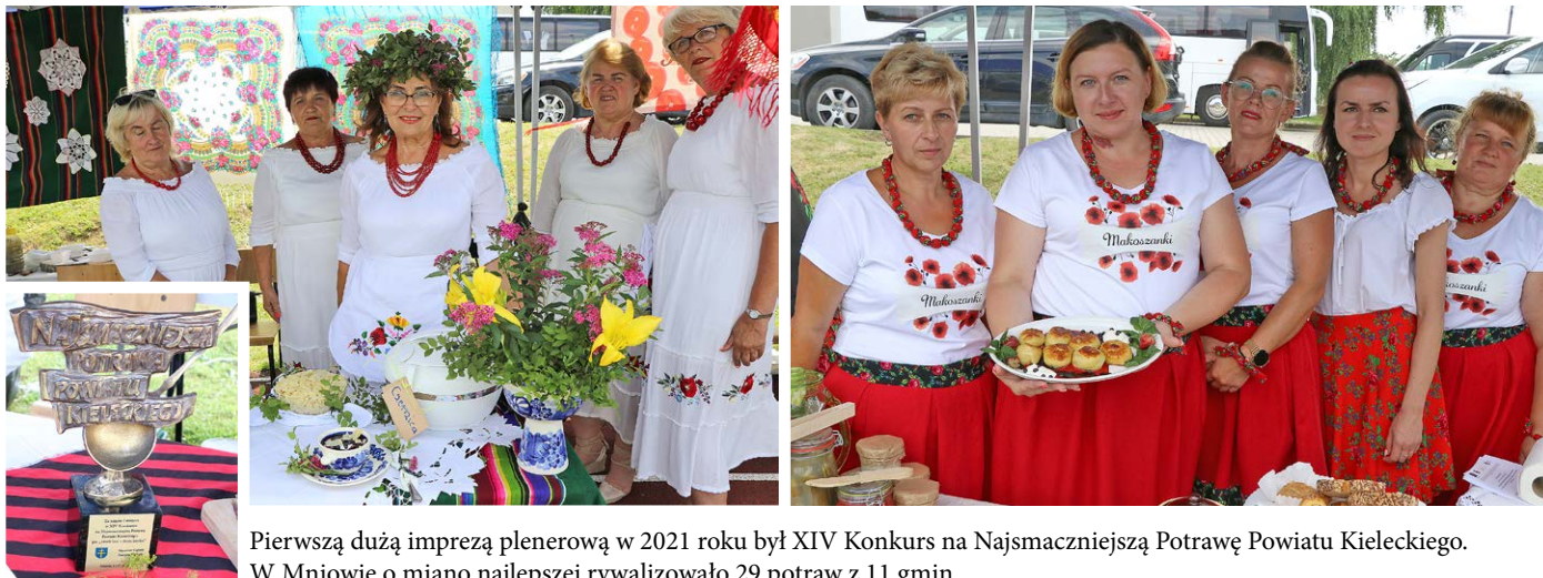
Pierwszą dużą imprezą plenerową w 2021 roku był XIV Konkurs na Najsmaczniejszą Potrawę Powiatu Kieleckiego. W Mniowie o miano najlepszej rywalizowało 29 potraw z 11 gmin.