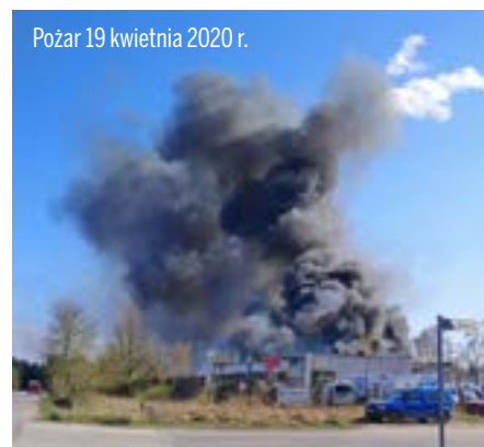
Pożar 19 kwietnia 2020 r.

konalibyśmy wiele inwestycji w powiecie kieleckim, ale dla dobra, zdrowia i życia mieszkańców doprowadziliśmy do szczęśliwego finału tej sprawy – dodał starosta.