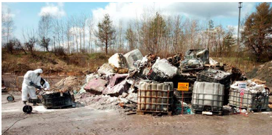
Trwają prace porządkowe na pogorzelisku w Nowinach.