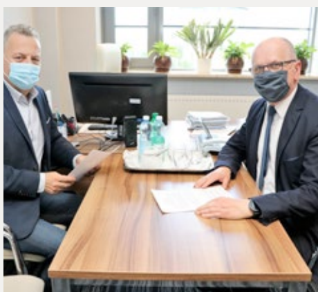
❑ Rozmowy o bieżącej sytuacji szpitala przy ul. Prostej w Kielcach