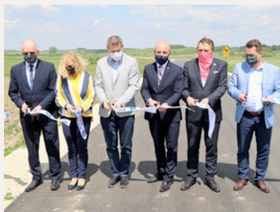
❑ Otwarcie drogi powiatowej w Chmielniku