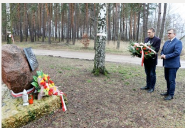
❑ Upamiętnili Antoniego Szackiego, ps. „Bohun”