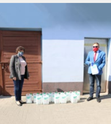
❑ Przekazanie płynów do dezynfekcji powiatowym jednostkom