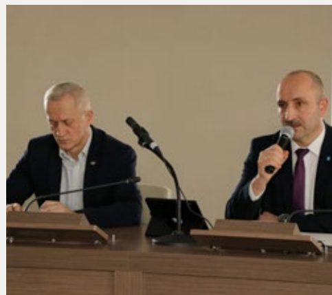
❑ Działania sztabu kryzysowego w ramach walki z koronawirusem