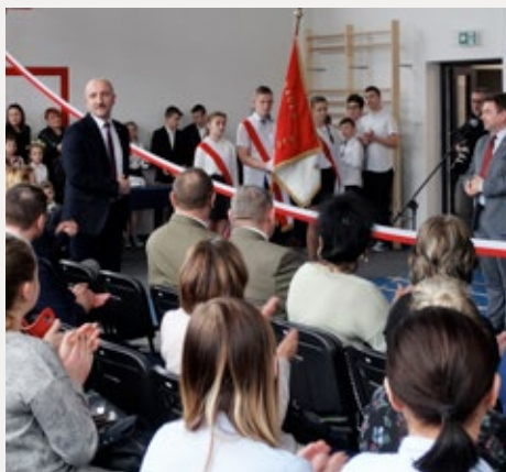
❑ Otwarcie hali sportowej w Społecznej Szkole Podstawowej w Drugni