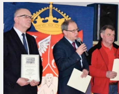
❑ Uczcili pamięć powstańców podczas rajdu w Nowej Słupia