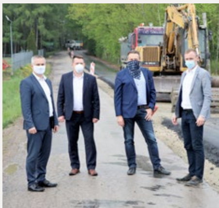
❑ Wizyty na remontowanych drogach powiatu