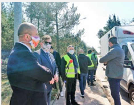
❑ Pożar nielegalnego składowiska odpadów w Nowinach