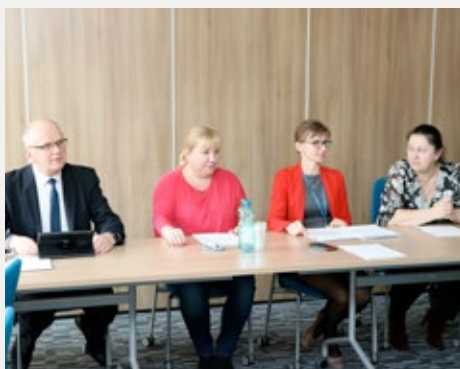
❑ Spotkanie Powiatowej Rady ds. Osób Niepełnosprawnych