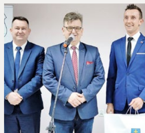
❑ Otwarcie świetlicy w Strawczynku