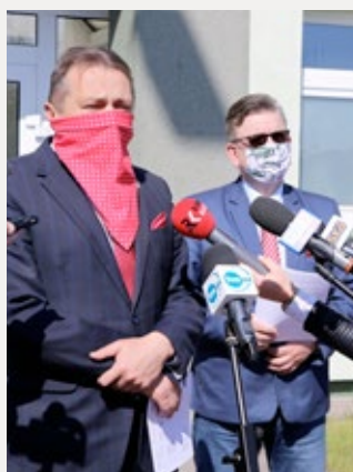
❑ Konferencja w ramach tarczy antykryzysowej