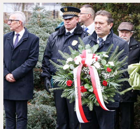
□ Na kieleckim Cmentarzu Starym pod pomnikiem Sybiraków wspomniano Polaków, których podczas pierwszej masowej deportacji wywieziono na Sybir.