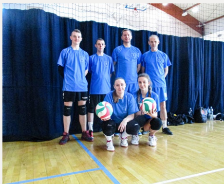
□ Reprezentacja powiatu kieleckiego zagrała w charytatywnym turnieju siatkarskich drużyn mieszanych.