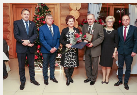
□ 18 par z gminy Nowa Słupia obchodziło piękny jubileusz pożycia małżeńskiego.