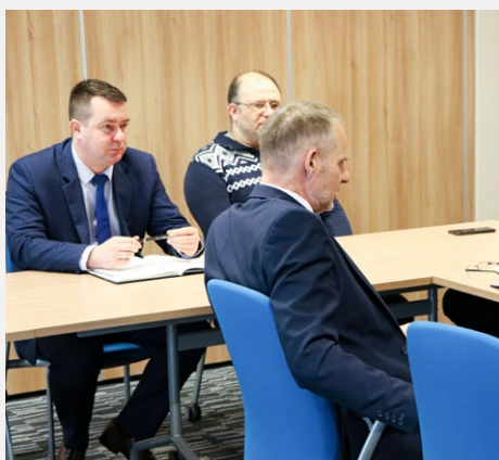
□ Zebranie diagnostów z powiatu kieleckiego.