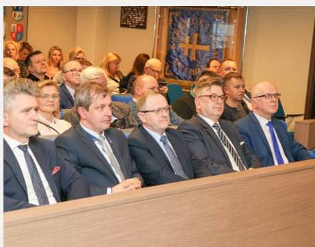
□ W siedzibie Starostwa odbyło się szkolenie dla organizacji pozarządowych z powiatu kieleckiego.