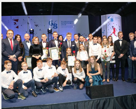
□ W Targach Kielce rozstrzygnięto 68. Plebiscyt Sportowy 2019 Świętokrzyskie Gwiazdy Sportu. Na zdjęciu nagrodzeni sportowcy z terenu powiatu kieleckiego.