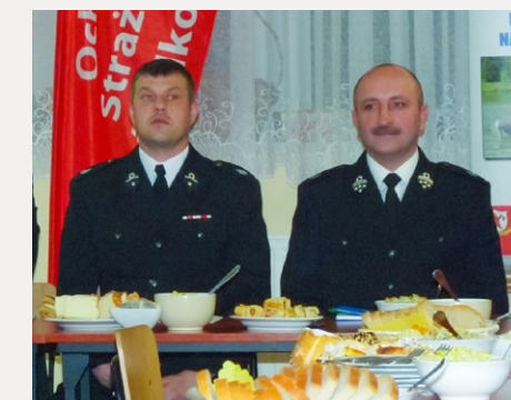
□ Zebranie sprawozdawcze jednostki Ochotniczej Straży Pożarnej w Śladkowie Małym.