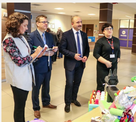
□ Kapituła konkursu ekologicznego „Zabawka z surowców wtórnych”.