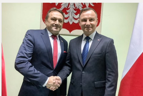
□ Prezydent RP Andrzej Duda odwiedził mieszkańców Włoszczowy.