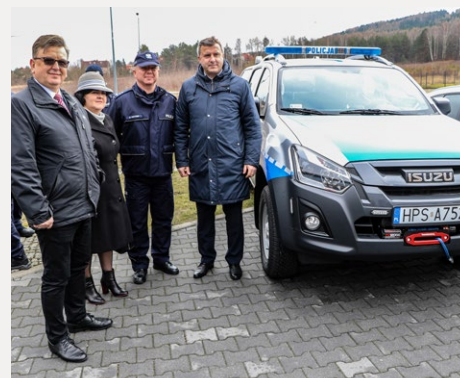
□ Policjanci z Daleszyc otrzymali terenowe isuzu, które sprawdzi się nie tylko w codziennej służbie, ale także podczas transportowania policyjnej łodzi.