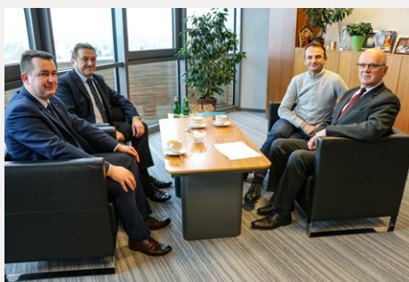
□ Na terenie powiatu kieleckiego odbędzie się niezwykła impreza kolarska – Świętokrzyska Liga Kolarska.